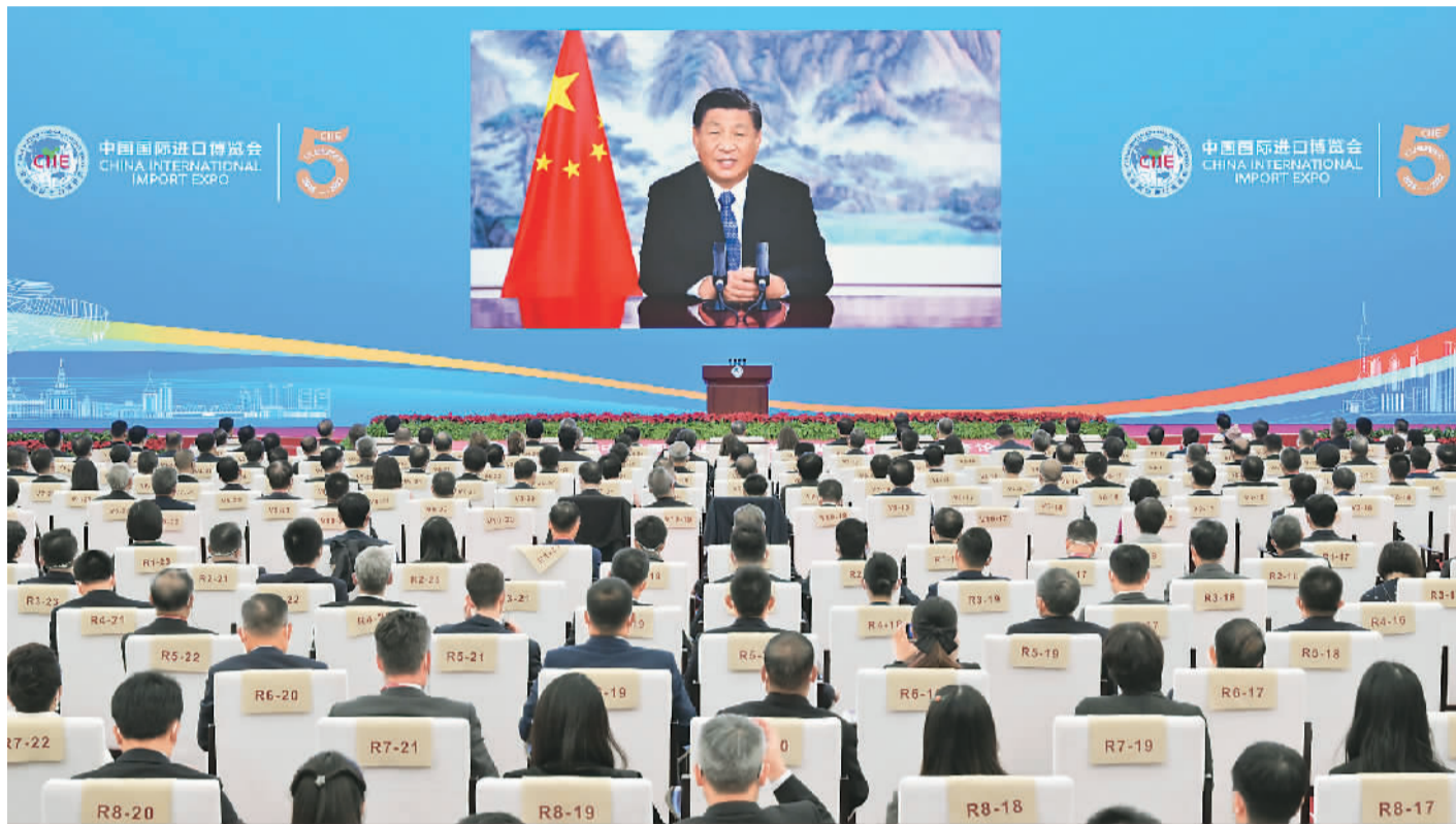
11月4日晚, 国家主席习近平以视频方式出席在上海举行的第五届中国国际进口博览会开幕式并发表题为《共创开放繁荣的美好未来》的致辞。