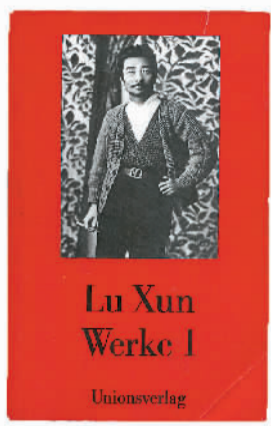
顾彬主编的德文《鲁迅选集》