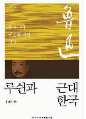
《鲁迅与近代韩国》 洪昔杓著

2011年10月18日，10多位来自浙江绍兴参加“鲁迅与现代文化·现代中国”暨纪念鲁迅诞辰130周年国际学术研讨会的中外鲁迅研究学者，发起成立了“国际鲁迅研究会”。此后10年间，鲁迅作品在海外传播与研究逐渐告别零散化、区域化，呈现出体系化、跨国化的新特点。鲁迅作品日益成为中外文明交流互鉴的重要窗口。