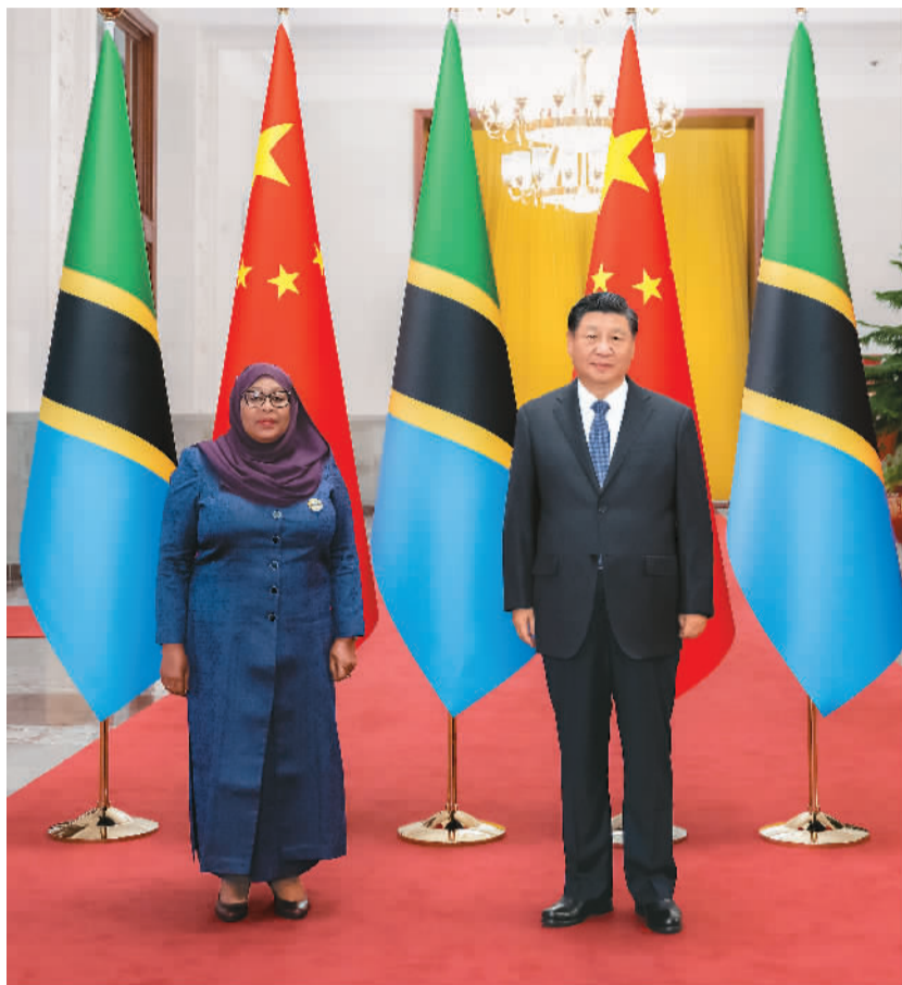
十一月三日下午, 国家主席习近平在北京人民大会堂同来华进行国事访问的坦桑尼亚总统哈桑举行会谈。这是会谈前, 习近平在人民大会堂北大厅为哈桑举行欢迎仪式。

新华社北京11月3日电 国家主席习近平11月3日下午在人民大会堂同来华进行国事访问的坦桑尼亚总统哈桑举行会谈。两国元首宣布, 将中坦关系提升为全面战略合作伙伴关系。