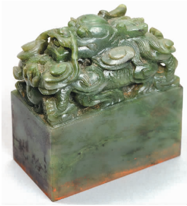
清代雕云龙纽碧玉“勤政殿”玺，故宫博物院藏。