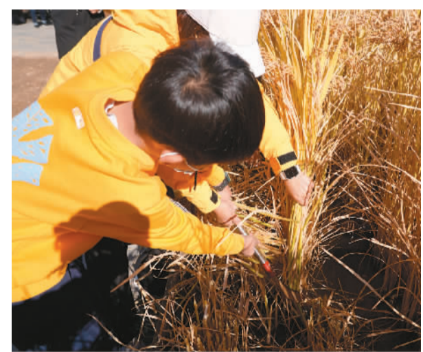
小朋友体验稻谷收割。