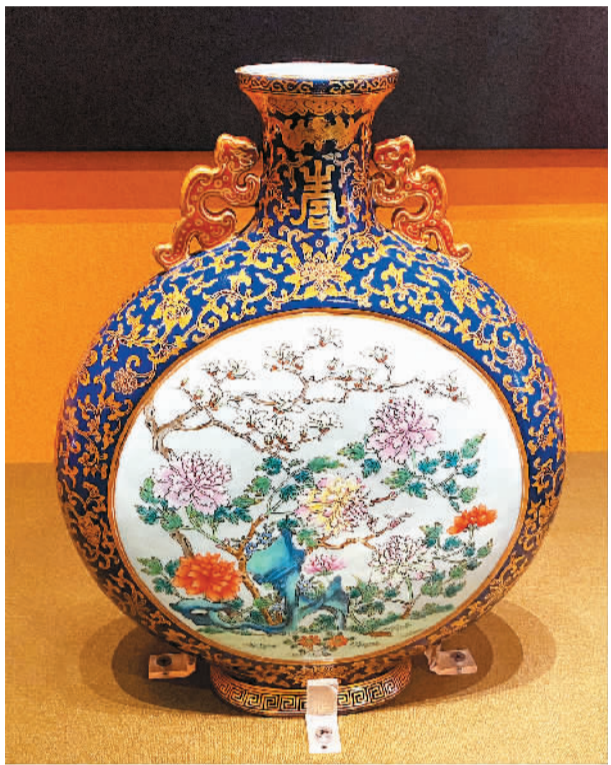
清代霁蓝釉描金开光粉彩御制诗文兽耳扁瓶，颐和园藏。