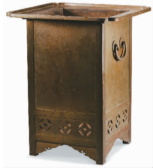
清代方形四足铜炉，颐和园藏。

清帝多次在三山五园接见外国使臣和来华传教士，并赐宴游赏。康熙五十九年（1720年），康熙帝在畅春园九经三事殿接见葡萄牙使臣斐拉理、罗马教皇使臣嘉乐等。乾隆五十八年（1793年），英国马戛尔尼使团访华，成为中西方文化交流史上的重要事件。晚清时期，颐和园成为清政府开展外交活动的重要舞台。展览中有一件18世纪在法国巴黎制造的铜镀金月相演示仪，推测为康熙时期由传教士携入清宫。“御制英吉利国王遣使臣奉表贡至诗以志事”青玉册则记录了乾隆接见马戛尔尼使团的经历。