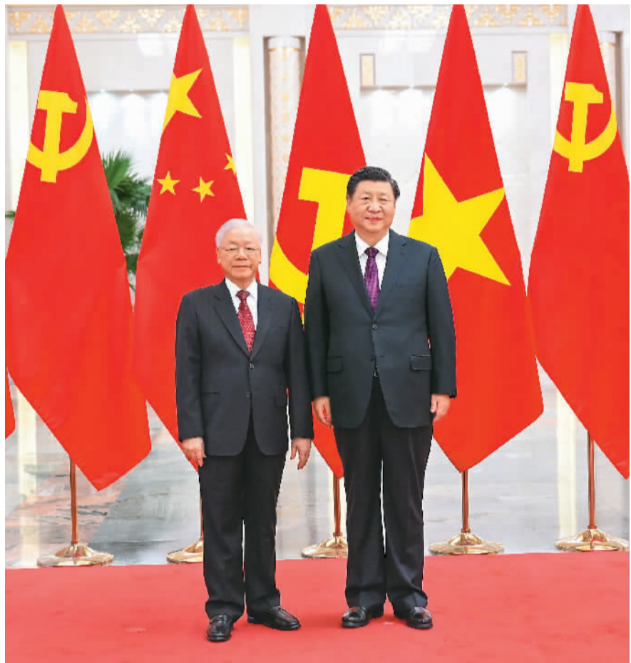
十月三十一日,中共中央总书记、国家主席习近平在北京人民大会堂同越共中央总书记阮富仲举行会谈。这是会谈前,习近平在人民大会堂北大厅为阮富仲举行欢迎仪式。