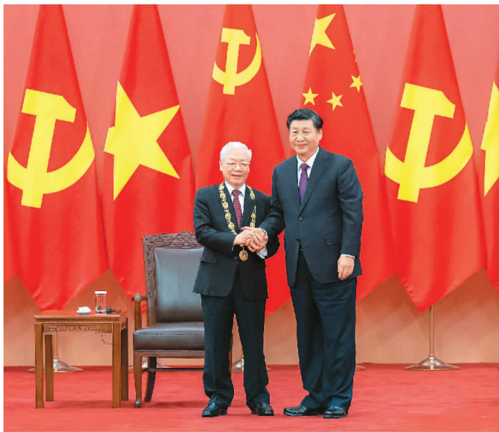
十月三十一日,中共中央总书记、国家主席习近平在北京人民大会堂向越共中央总书记阮富仲授予“友谊勋章”,并举行隆重颁授仪式。

新华社北京10月31日电 10月31日,中共中央总书记、国家主席习近平在北京人民大会堂向越共中央总书记阮富仲授予中华人民共和国“友谊勋章”,并举行隆重颁授仪式。宏伟的金色大厅内,气氛庄重、热烈,巨幅红色背景板上,“友谊勋章”的图案格外醒目。背景板前,中国共产党和越南共产党党旗、中越两国国旗整齐排列。仪式开始,中国人民解放军仪仗队礼兵正步入会场,登上授勋台,分列两侧。礼乐声中,习近平和阮富仲一起步入大厅。中越双方嘉宾全体起立,热烈鼓掌。习近平和阮富仲登上授勋台。军乐团奏越中两国国歌。中共中央政治局委员、国务委员兼外交部长、党和国家功勋荣誉表彰工作委员会副主任王毅宣读中华人民共和国主席授勋令。礼兵护送“友谊勋章”入场。礼号响起,习近平郑重为阮富仲佩戴勋章。全场响起热烈掌声。习近平发表讲话。习近平指出,阮富仲总书记是坚定的马克思主义者,是中国共产党的亲密同志和真诚朋友。在阮富仲总书记高度重视和亲自推动下,中越两党两国传统友谊得到巩固,政治互信不断增强,务实合作持续深化,交流互鉴日益密切。“友谊勋章”代表了中