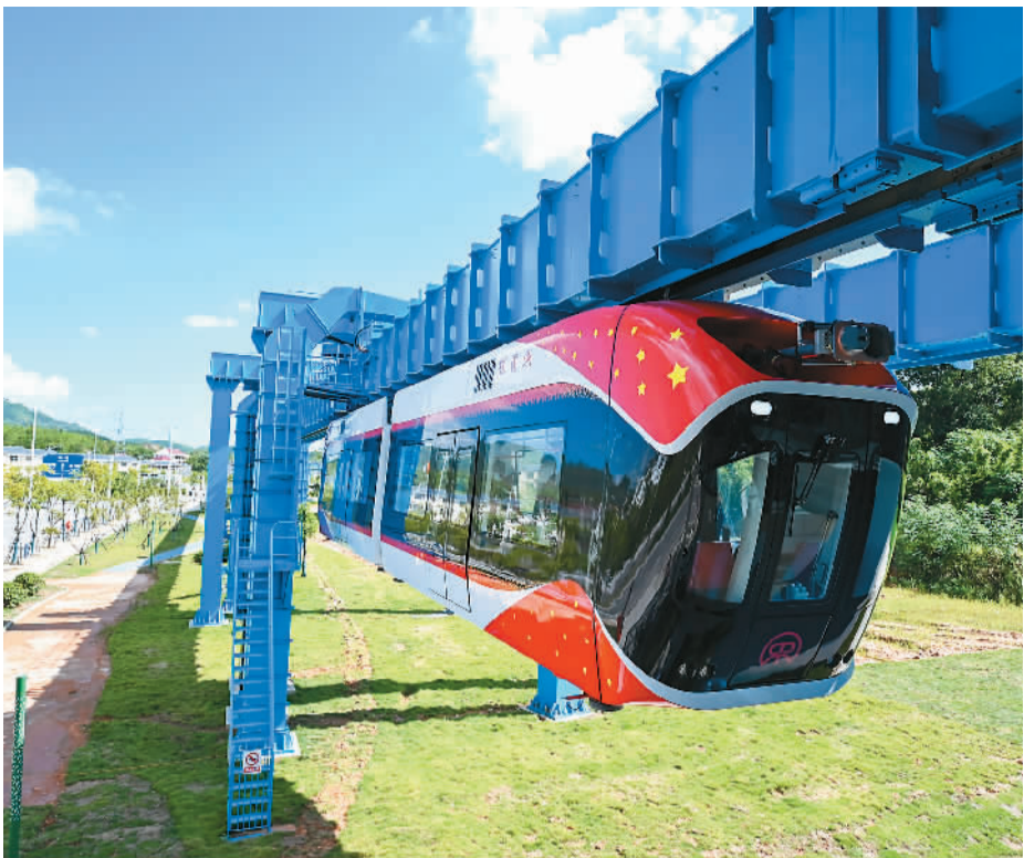
▲ 自主创新能力不断增强。8月9日,我国具有完全自主知识产权的国内首条稀土永磁磁浮轨道交通工程试验线——“红轨”在江西省兴国县正式竣工。图为行驶中的“红轨”试验线列车。