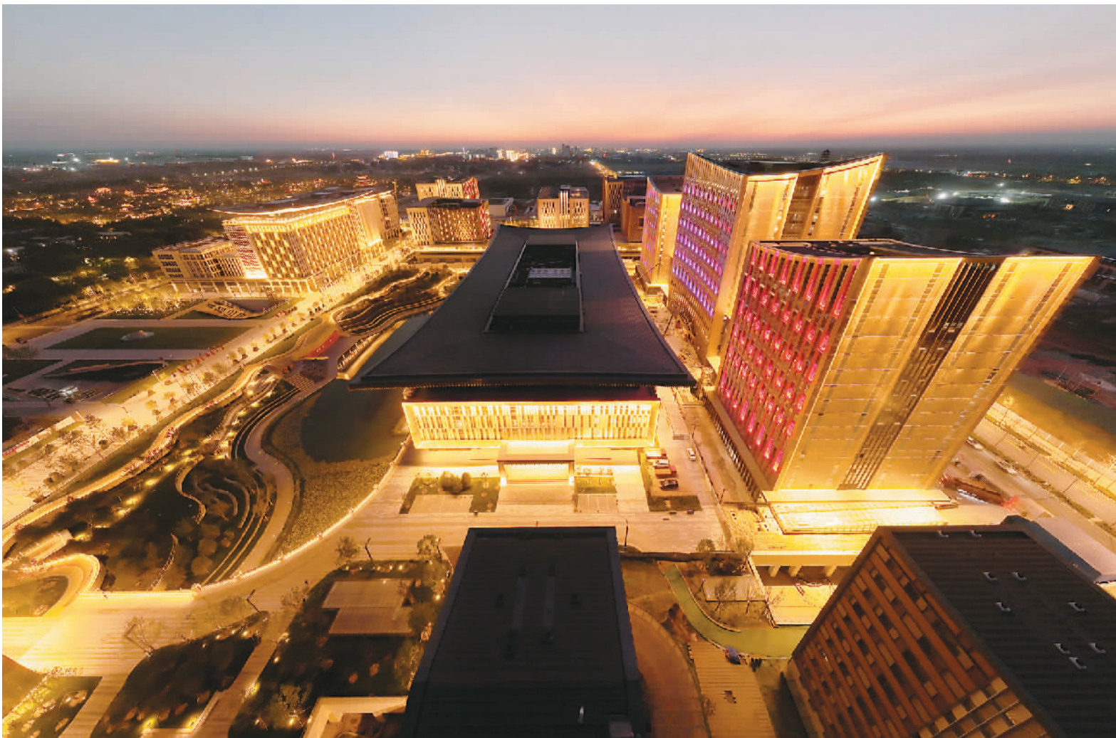
▶ 未来之城日新月异。2017年至今,雄安新区从“一张白纸”着墨,每天都在积蓄力量、拔节生长。图为2022年9月7日拍摄的雄安新区商务服务中心。