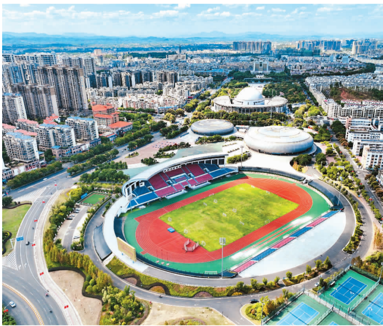
▲ 市民健身有了新去处。近年来,江西省赣州市把建设体育公园作为提高城市品位、完善城市绿地系统的重要举措,打造人与自然和谐相处的城市,使老百姓享有更多惬意的休闲空间。图为10月26日拍摄的赣州市南康区体育公园。