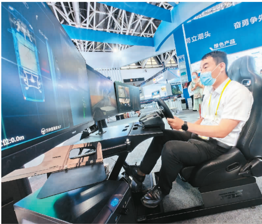
▶ “一带一路”经贸合作不断挖掘新增长点。“一带一路”倡议提出九年来,我国与沿线国家贸易规模稳步提升。目前,绿色产业、智能制造正成为“一带一路”经贸合作新增长点。图为八月十六日,在陕西省西安市举行的第六届丝绸之路国际博览会陕煤集团展位上,参会者体验无人驾驶胶轮车系统。