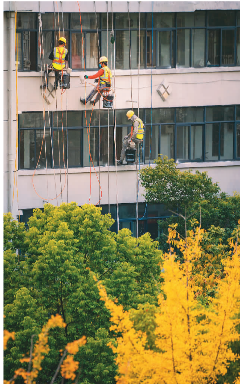
▲ 共享发展持续加强,居住环境焕然一新。安徽省马鞍山市持续推进老旧小区改造,实现老旧小区共建共治共享,让其真正成为老百姓满意的幸福工程、民心工程。图为10月21日,工作人员正在马鞍山市花山区矿山新村楼房外粉刷墙面。