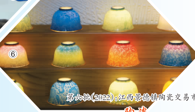
第六批(2022):江西景德镇陶瓷交易市场