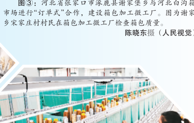
第三批(2015):江苏海门叠石桥国际家纺城