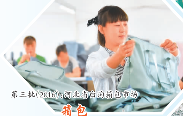
第三批(2016):河北省白沟箱包市场