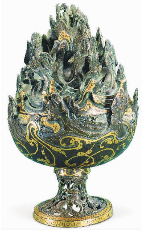
西汉错金博山炉，河北博物院藏。

百年考古，硕果累累。考古科学发现在中华大地上翻开的一页页历史华章，带给我们自信的底气和前行的力量。