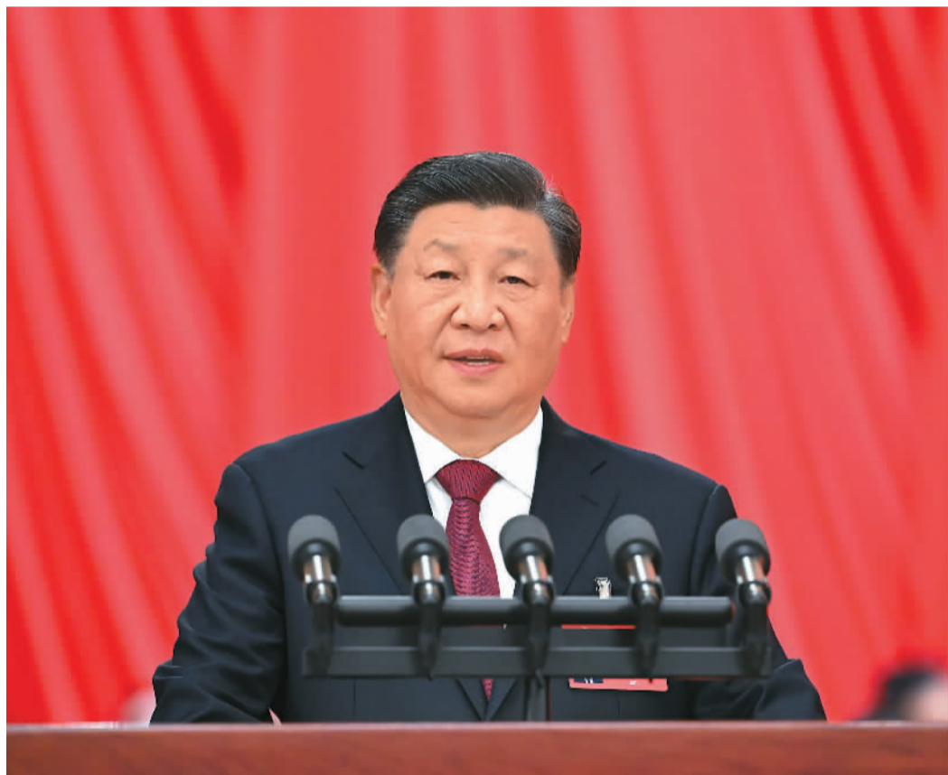
10月16日,中国共产党第二十次全国代表大会在北京人民大会堂开幕。习近平代表第十九届中央委员会向大会作报告。