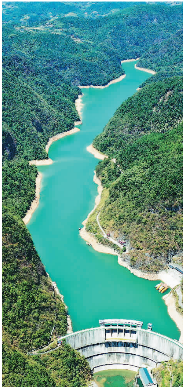
2022年9月7日，湖南省涟源市大江湖水库宛若镶嵌在苍翠青山间的一块“碧玉”。

（本报记者张焱、盛玉雷、宦翔、庞革平、常钦、王璠、罗珊珊、黄超、刘新吾、龔皓、孙振、徐雷鹏参与采写）