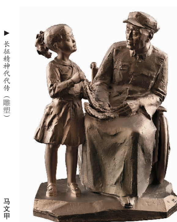
▶ 长征精神代代传（雕塑）