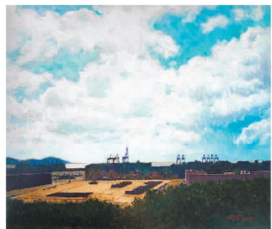
▲ 洋山港新貌（油画） 靳尚谊