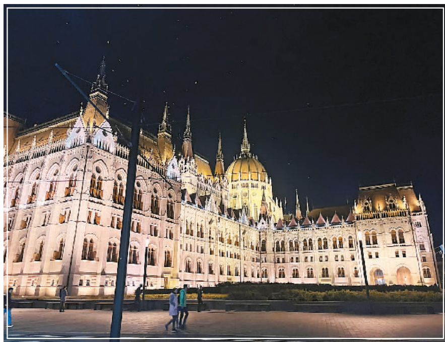
夜幕中的匈牙利国会大厦。

5月初，猴痘病毒在欧洲开始流行，两种极强的传染病叠加，让大家再次陷入不安。较长时间的独处和压抑氛围，更易让人惆怅、烦躁，我身边有同学开始变得抑郁，整晚整晚无法安眠，情绪很低落。