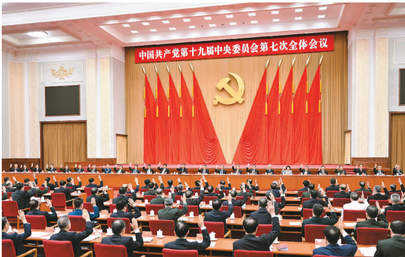
中国共产党第十九届中央委员会第七次全体会议,于2022年10月9日至12日在北京举行。中央政治局主持会议。