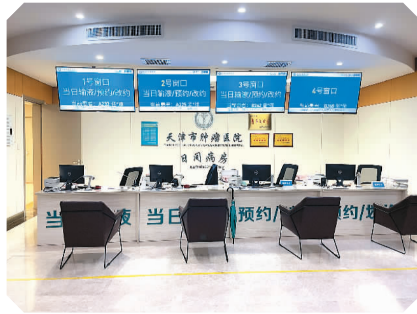
图为天津市肿瘤医院日间病房一角。