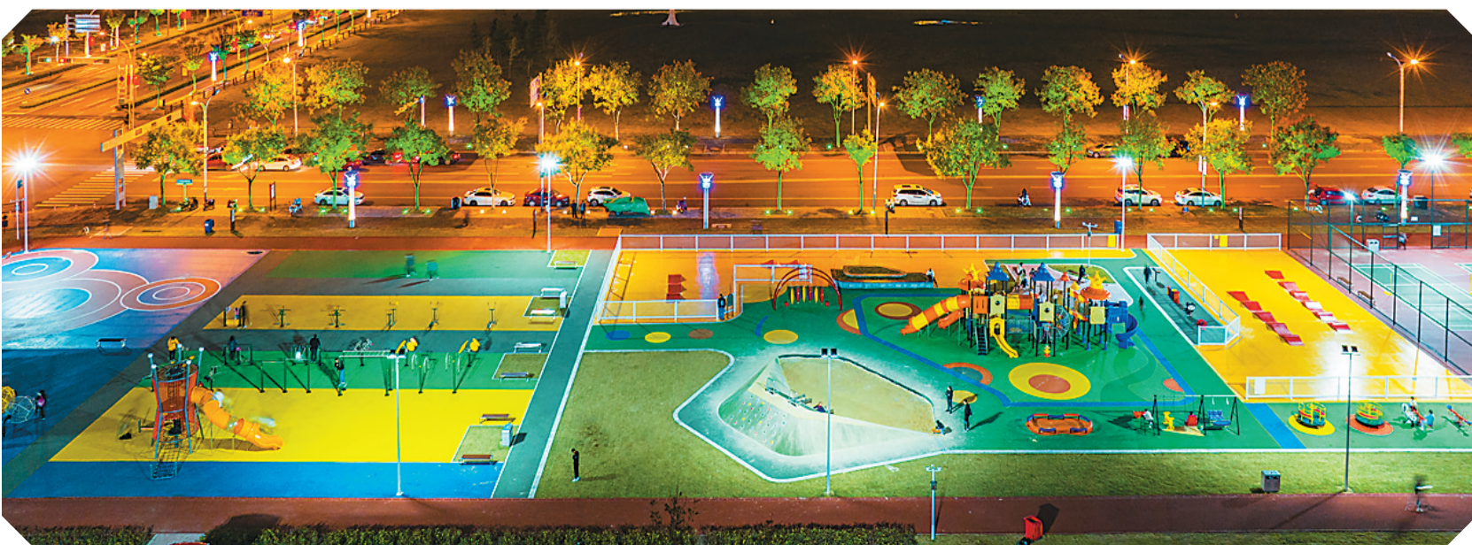
今年“十一”前夕，江苏省宿迁市宿豫工业园区在园区建设了2.2万平方米的居民公益健身公园，园内不仅有常规健身设施和篮球场、网球场、门球场等球类运动场，还专门设立了儿童健身中心，满足了老中青幼不同年龄段居民的健身需求。

天津医科大学总医院主任医师刘健表示，在医疗资源紧缺背景下，通过日间手术，最大限度满足患者医疗需求，缓解“一床难求”的痛点，是公立医院适应医改、实现高质量发展、贯彻落实健康中国战略部署的应有之义。