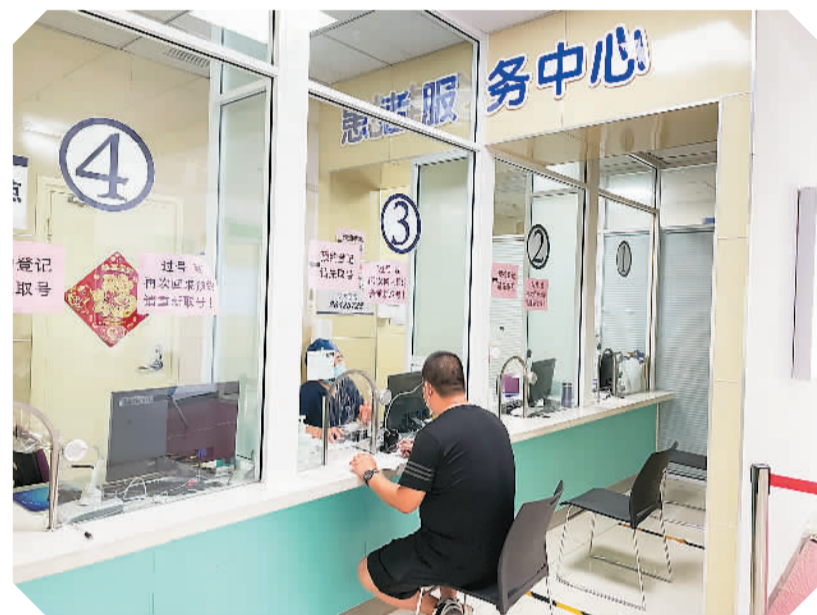
图为患者在天津医科大学眼科医院办理入院手续。