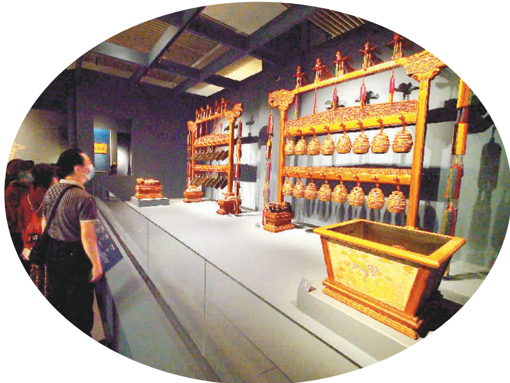
左图：观众欣赏清代“中和韶乐”乐器。右图：清乾隆金胎珐琅人物图执壶。