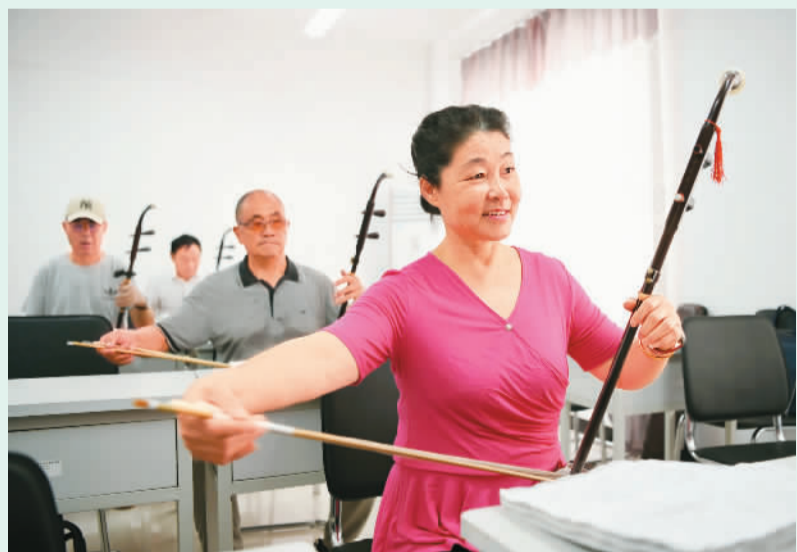
图为9月15日，老人们在安徽省铜陵市义安区老年大学教室里学二胡。

在提升养老服务质量方面，中国建立了养老服务标准体系，基本形成全国统一的服务质量标准