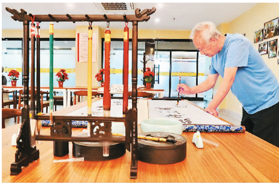
图为7月13日，位于河北省秦皇岛市海港区海阳镇的秦皇岛老年大学内，一位老人正在练习书法。

国家卫健委医院管理研究所副所长王凯指出，公立医院党建需要重点解决坚持和加强党对医院工作的全面领导、认真执行医院党委领导下的院长负责制、加强思想政治工作和医德医风建设等重点问题。