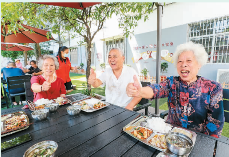
图为9月21日，老人们在江西省萍乡市安源区凤凰街凤凰社区“爱心食堂”享用午餐。

完善标准规范、摸清问题短板、加快设施建设……近年来，住建部发布《城镇老年人设施规划规范》等标准规范，组织开展社区养老等基本公共服务调查研究工作，因地制宜补齐养老服务设施建设短板。2019年到2021年，各地在老旧小区改造中推动既有住宅加装电梯5.1万部；2020年至2022年上半年，各地建设改造社区养老、助餐等服务设施约3.6万个，更好满足老