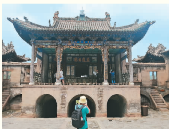
位于制高点的黑龙庙戏台。