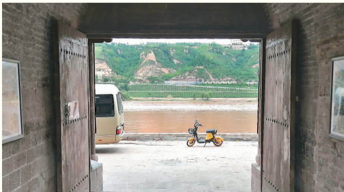
开门见黄河的碛口人家。