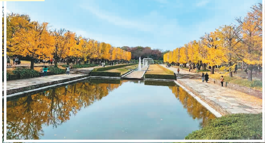
昭和纪念公园园内景色。

回到集合点，大部队计划继续向着公园里的日式庭园进发。我曾参加过公园的夜间点灯活动，沉醉于那里“月落鸟啼霜满天，江枫渔火对愁眠”