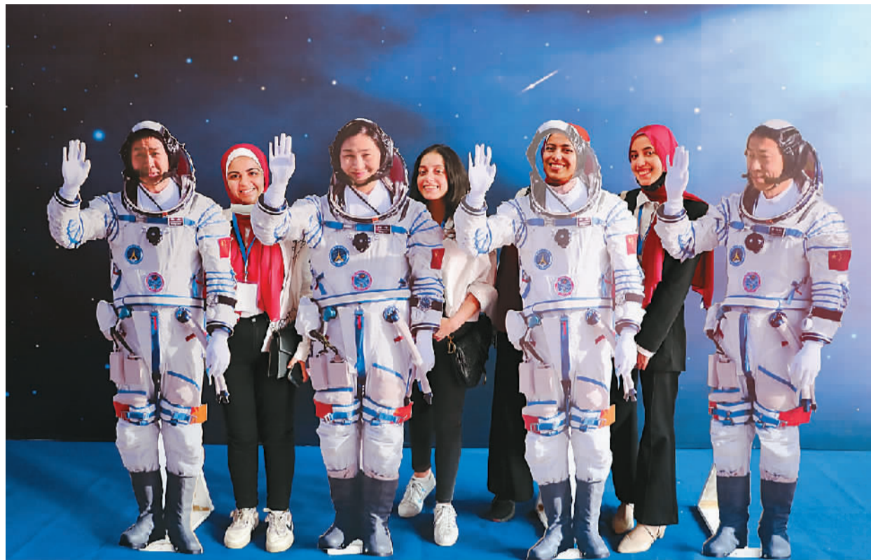
上图：9月6日，在埃及开罗，埃及青年学生在“天宫对话”活动埃及分会场拍照。

出舱舱门更大。神舟十二号、神舟十三号乘组出舱时，通过的舱门是位于空间站核心舱节点舱的出舱口，舱门口径为85厘米。而本次任务，航天员首次从问天实验舱气闸舱“出门”，舱门口径达到了1米，让航天员在身着舱外航天服的情况下，能够更从容地携带设备“走出家门、遨游太空”。