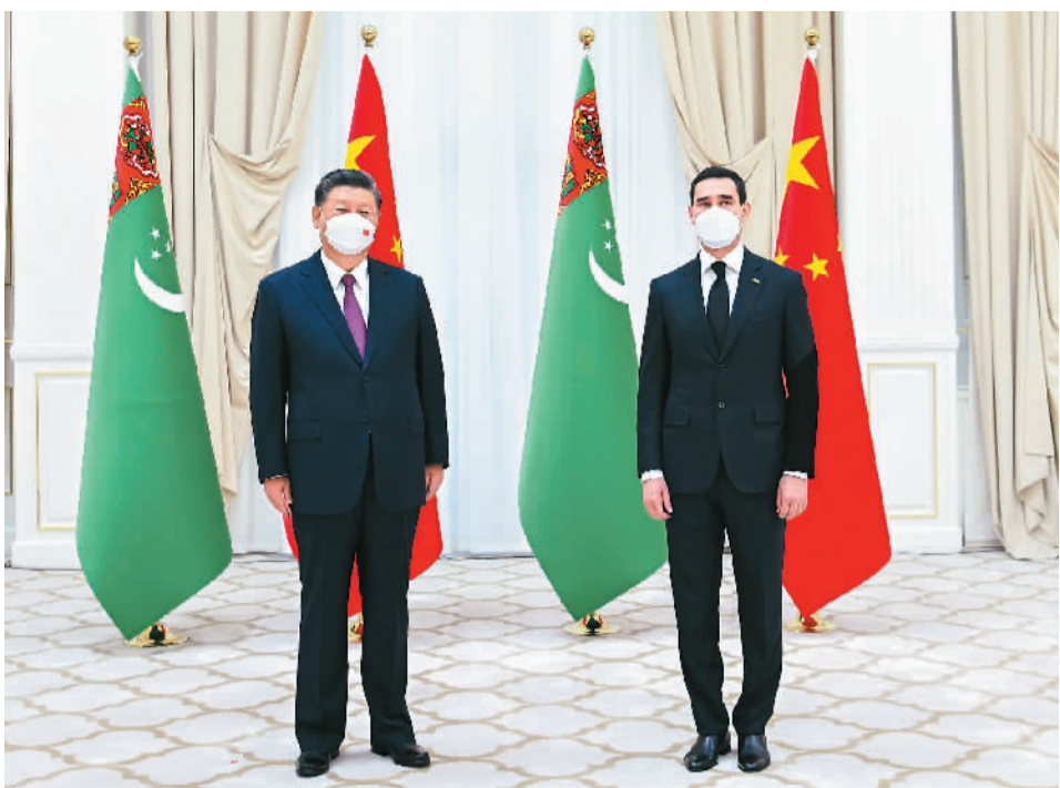
当地时间9月15日上午，国家主席习近平在撒马尔罕国宾馆会见土库曼斯坦总统谢尔达尔·别尔德穆哈梅多夫。

本报乌兹别克斯坦撒马尔罕9月15日电（记者隋鑫、肖新）当地时间15日上午，国家主席习近平在撒马尔罕国宾馆会见土库曼斯坦总统谢尔达尔·别尔德穆哈梅多夫。