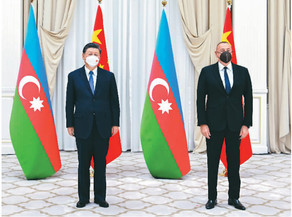
当地时间9月15日下午，国家主席习近平在撒马尔罕国宾馆会见阿塞拜疆总统阿利耶夫。

本报乌兹别克斯坦撒马尔罕9月15日电（记者肖新、张朋辉）当地时间15日下午，国家主席习近平在撒马尔罕国宾馆会见阿塞拜疆总统阿利耶夫。