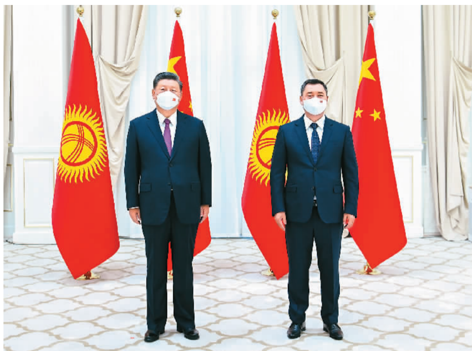
当地时间9月15日上午，国家主席习近平在撒马尔罕国宾馆会见吉尔吉斯斯坦总统扎帕罗夫。

本报乌兹别克斯坦撒马尔罕9月15日电（记者肖新、张朋辉）当地时间15日上午，国家主席习近平在撒马尔罕国宾馆会见吉尔吉斯斯坦总统扎帕罗夫。