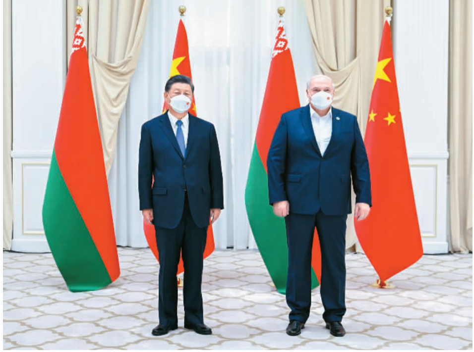
当地时间9月15日下午，国家主席习近平在撒马尔罕国宾馆会见白俄罗斯总统卢卡申科。

本报乌兹别克斯坦撒马尔罕9月15日电（记者张朋辉、隋鑫）当地时间15日下午，国家主席习近平在撒马尔罕国宾馆会见白俄罗斯总统卢卡申科。两国元首决定，将双边关系定位提升为全天候全面战略伙伴关系。