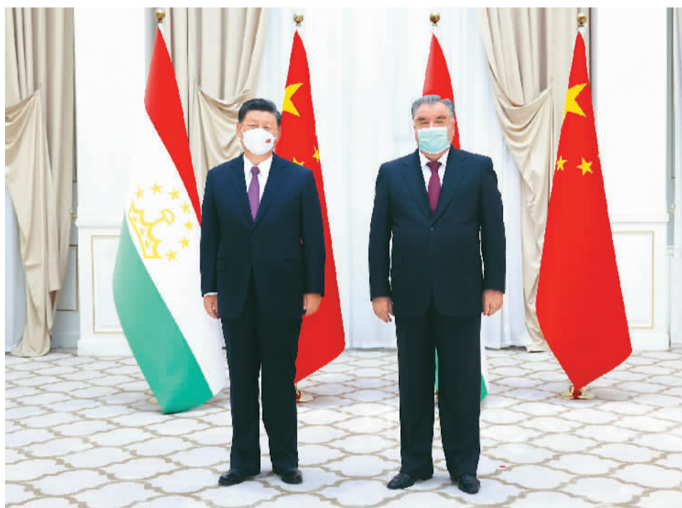
当地时间9月15日上午，国家主席习近平在撒马尔罕国宾馆会见塔吉克斯坦总统拉赫蒙。

本报乌兹别克斯坦撒马尔罕9月15日电（记者张朋辉、隋鑫）当地时间15日上午，国家主席习近平在撒马尔罕国宾馆会见塔吉克斯坦总统拉赫蒙。