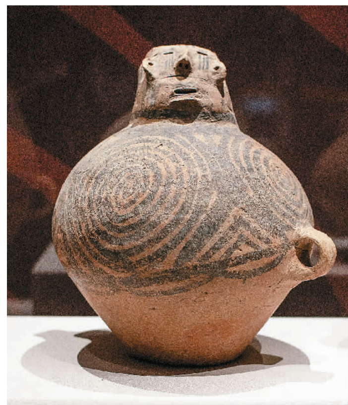
马家窑文化马厂类型人头像彩陶壶。

“海东作为河湟文化的腹地，自古是节制西域、怀柔蒙藏、拱卫三秦的战略要地，留下了丰厚的文化遗产。”王宝业说，河湟文化博物馆是海东市精心打造的文化工程，对于保护传承河湟地区文化遗产，讲好海东故事、河湟故事具有重要意义。