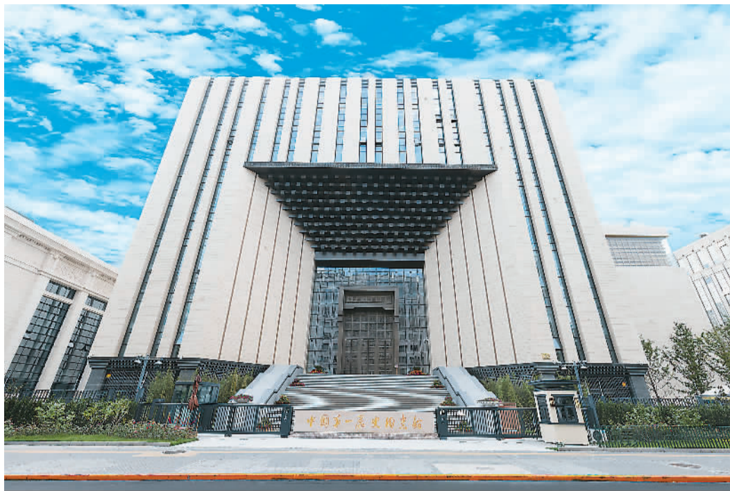
中国第一历史档案馆新馆外观。

中国第一历史档案馆是专门负责收集管理明、清两朝及以前各朝代中央机构形成档案的中央级国家档案馆，前身为1925年成立的故宫博物院文献部，是中国历史上第一个现代意义的专业档案机构。2021年7月，中国第一历史档案馆新馆开馆，今年7月，新馆向社会公众全面开放。馆内展出的大量珍贵档案，让观众感受到历史的温度。