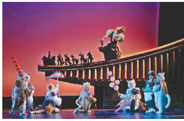
▲儿童剧《用端》剧照

全国巡演，让全国各地的观众在家门口就可以亲近大美故宫，爱上文物，爱上中华优秀传统文化。