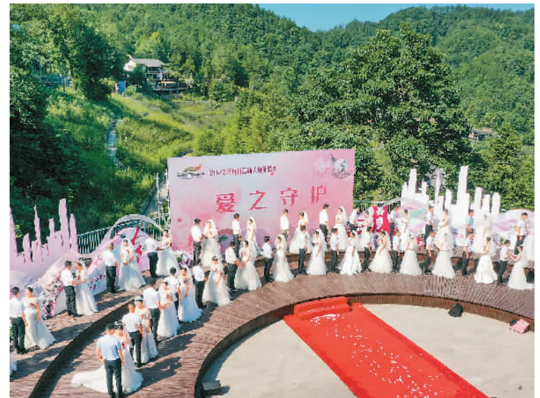
在中国传统节日七夕，不少新人选择在这一天登记结婚、举办婚礼，让这美好的日子见证爱情。因为今年七夕新人们在重庆万州三峡恒合旅游度假区参加集体婚礼。新华社记者 王全超摄