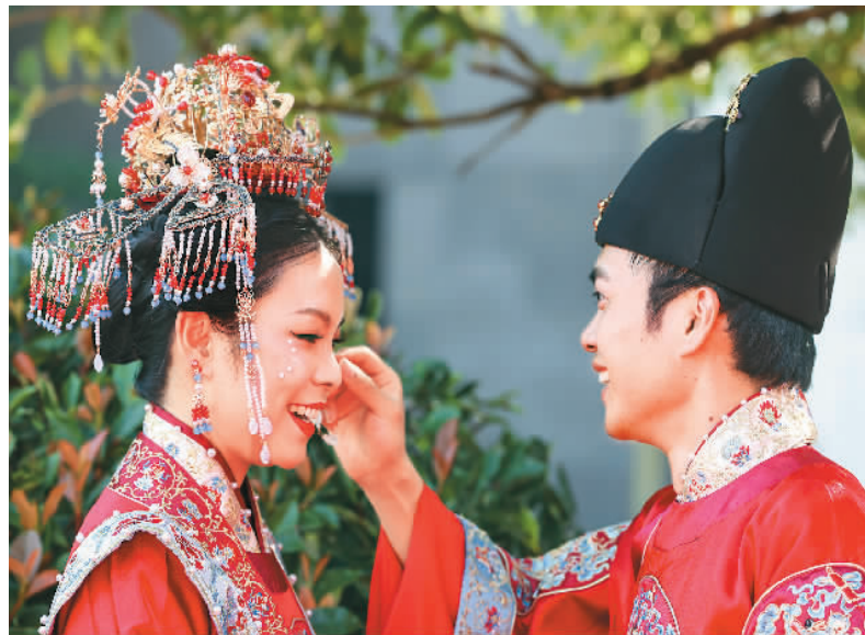
近日，贵阳孔学堂中华婚礼在贵州省贵阳市贵阳孔学堂举办，12对新人身穿中式婚服通过合卺礼、解缨结发、共书婚帖等方式完成传统婚礼仪式。图为新郎在婚礼现场为新娘整理发饰。