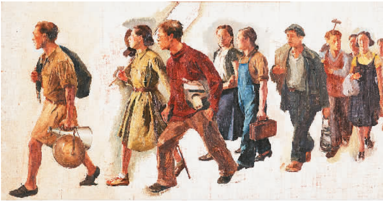
七七的号角（油画） 唐一禾