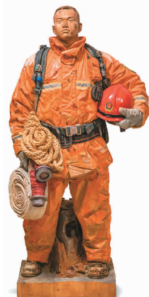
烈焰青春（雕塑） 焦兴涛

近日，由中国美术馆与共青团中央宣传部共同主办的“美术作品中的青春——中国美术馆藏经典作品展”在中国美术馆举行。展览展出中国美术馆藏品有刘开渠1984年创作的《青年》160余件，分为表现革命主题的“青春的信仰”、表现新中国建设情景的“激昂的青春”以及表现改革开放尤其是新时代以来多彩生活的“多姿的青春”三部分。