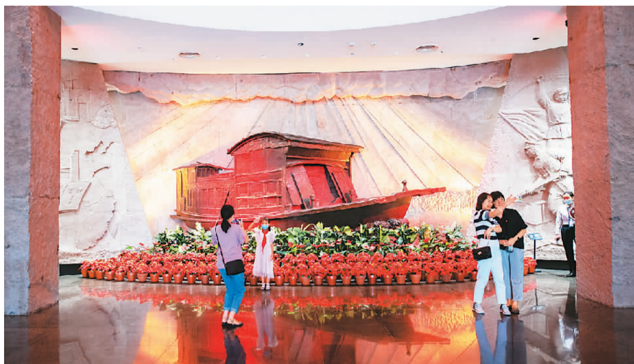
暑假期间，家长们带着孩子来到浙江嘉兴的南湖革命纪念馆，参观历史文物，聆听革命故事，增强爱国意识，传承红色精神。

参观红色展馆，在革命文物中回望历史；走进革命圣地，实地感悟红色精神；聆听红色宣讲，在红色故事中厚植爱国情怀。临近开学，许多大中小学生走进“红色课堂”，接受红色教育，上好“红色第一课”。