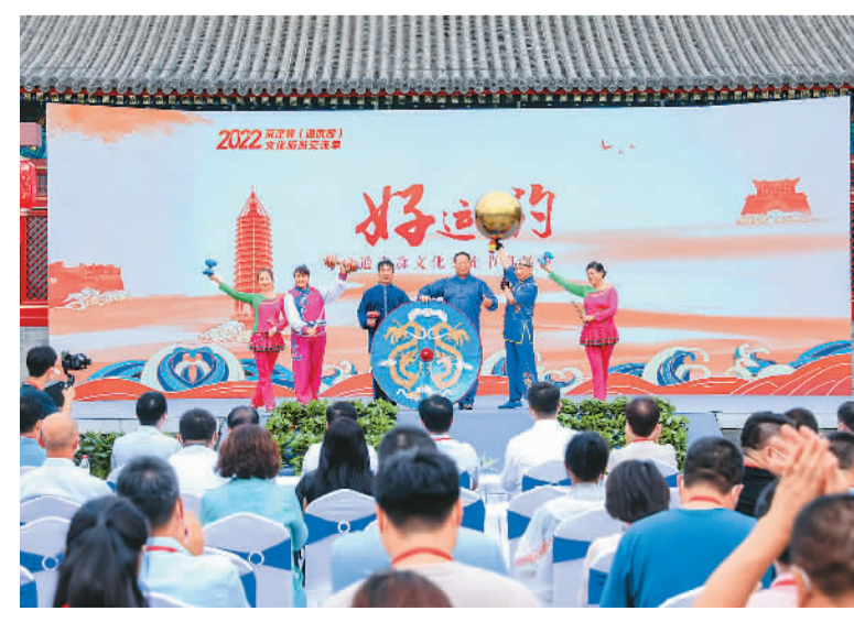
“好运有约”通武廊文化交流节目展演。

据悉，本届文化旅游交流季以“国潮”为主线，对“通武廊”同根同源的运河文脉进行深入诠释，将陆续推出“盛世北运河”京津冀运河名家作品展、“古运河通州·相约北三县”河畔好物市集、“寻迹北运河”文化交流、“通武廊”家宴等主题活动及形式丰富的互动体验。本次交流季将持续至9月中旬。