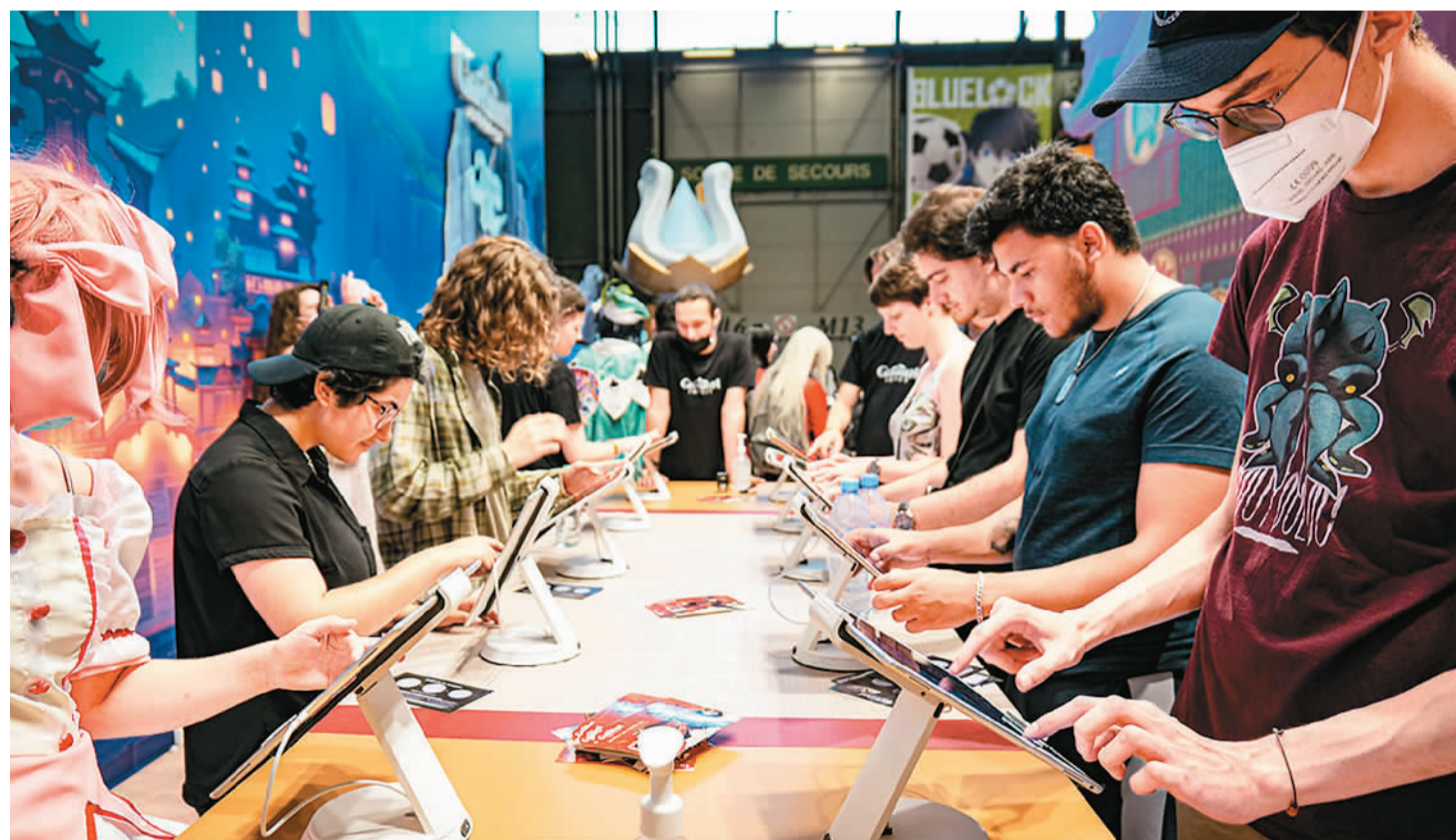
今年7月在法国巴黎举办的综合性动漫展会Japan Expo上，国产游戏《原神》展台前吸引了众多游戏爱好者。