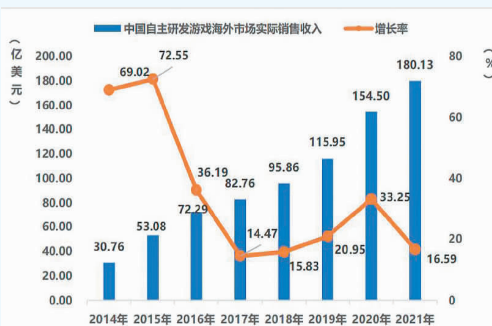
图表来源：伽马数据