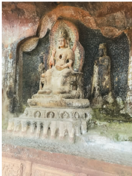
图为被誉为“剑川微笑”的甘露观音造像，位于第7号石窟。

据文物专家考证，石钟山石窟始凿于唐大中四年（公元850年），止于南宋淳熙六年（公元1179年），前后历时320多年。石窟依山傍崖，开凿在绵延37平方公里的峭壁山石上，迄今共发现17个石窟，造像200多躯，另有造像题记4则，游人题记40余则。1961年，石钟山石窟和敦煌莫高窟、大同云冈石窟、洛阳龙门石窟一道成为全国第一批重点文物保护单位。