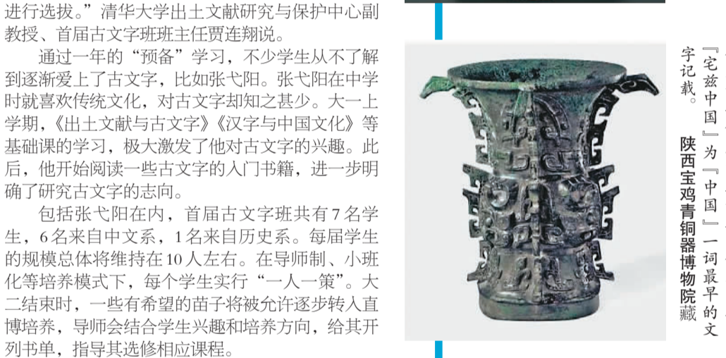
西周青铜器“何尊”。尊内底铸有铭文十二行，为一百二十二字铭文，其中“宅兹中国”“唯兹二河”等语，是“中国”一词最早的文献记载。陕西宝鸡青铜器博物院藏