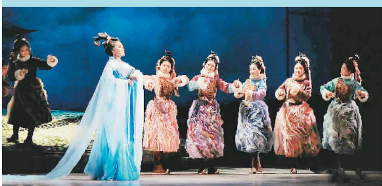
南音被誉为“中国音乐史上的活化石”，是中国的古老乐种，入选联合国教科文组织人类非物质文化遗产名录，广泛传播于福建闽南地区、港澳台地区以及海外闽南华侨华人聚居地。其传统演奏演唱形式为琵琶、三弦、洞箫、二弦伴奏，执拍板者居中而歌，与汉代“丝竹更相和，节者歌”的相和歌一脉相承。现存古曲谱中蕴含晋清商乐、唐大曲等内容，风格古朴，文辞典雅。以千年古乐南音演绎千古历史名篇“文姬归汉”，可谓相得益彰、珠联璧合。

《文姬归汉》由“战乱被掳”“胡地思乡”和“别子归汉”3个乐章构成。曲词延续南音抒情传统，有机融入古典诗歌意象。作曲家在保留南音传统“四大件”乐器的基础上，引入古琴、编钟、埙、鼓、云锣等中国古老乐器和西洋弦乐等进行配器。整部剧以强烈的现代意识，融汇中西剧场语汇，积极探索中国故事和中国精神的当代表达。