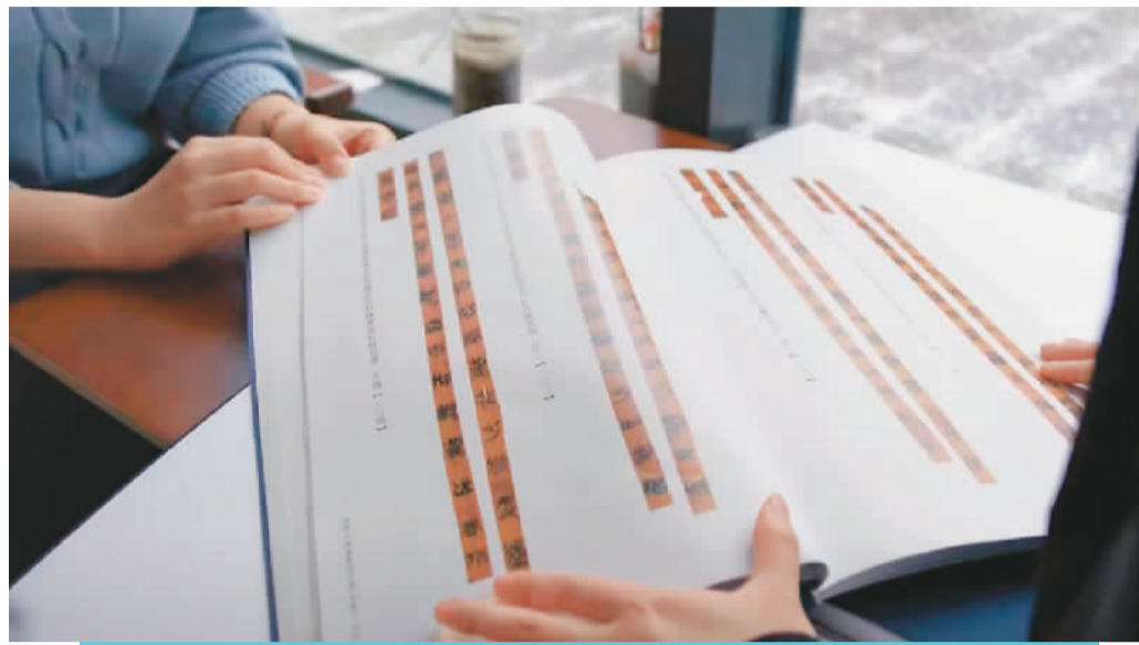
清华大学“强基计划”首届古文字班的老师在为学生展示古文字材料。视频截图