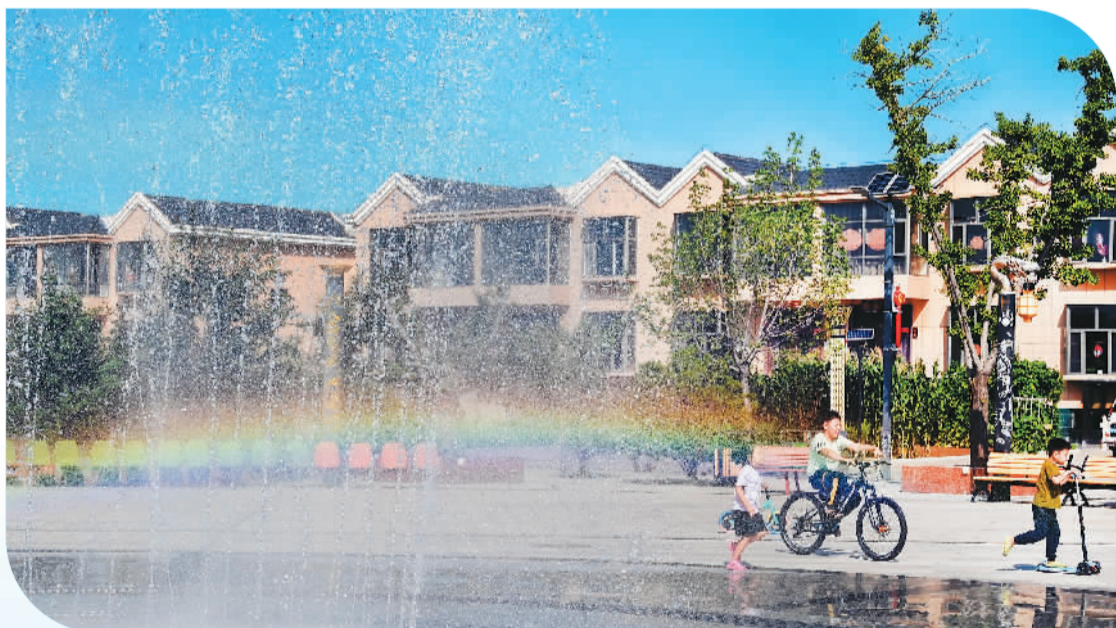
◀ 多年来,神木市西沟街道四卜树村累计造林种草2.6万亩,全村林草覆盖率达70%以上。村民由五沟八岔的偏僻之地统一搬进设施齐全、功能完善、美丽宜居的现代新型农村社区,这里也成为“国家级美丽宜居村庄示范村”。图为小朋友在四卜树村广场玩耍。