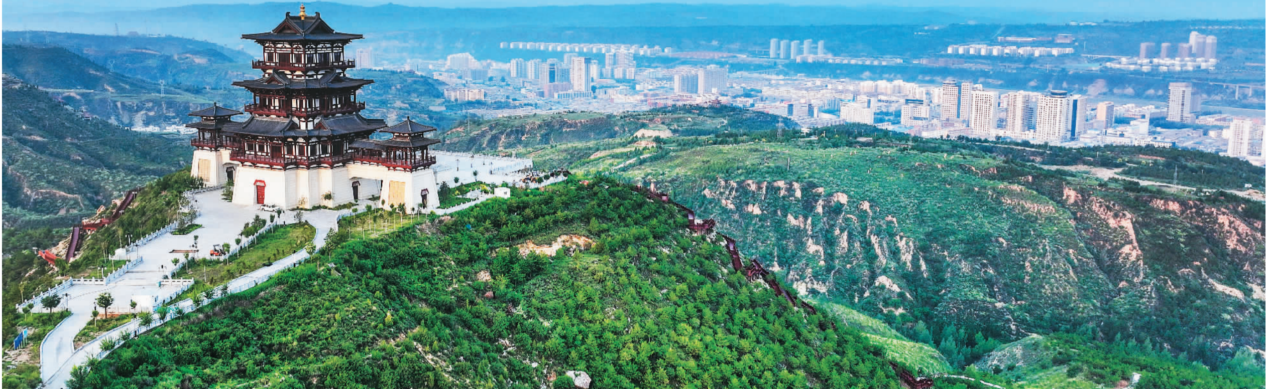
▲ 陕西省神木市东山森林公园植被覆盖率从当初的1%上升到97%,成为一处集森林休憩、休闲娱乐、运动健身、科普教育和地域文化展示为一体的综合性城郊森林公园。图为远眺神木市东山森林公园。

近年来,以产煤闻名的陕西省神木市加快新旧动能转换,构建集群发展、高端低碳的现代产业体系。同时,实施黄土高原水土流失综合治理、退耕还林还草、沿黄防护林提质增效建设等林业重点建设项目。目前全市各类林木保存面积达495万亩,森林覆盖率上升到43.2%,成为国家园林城市和省级森林城市,人们传统印象中的“荒山秃岭”正被满目青山绿水所替代。