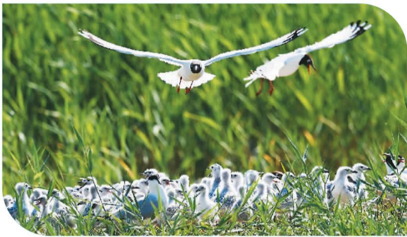
◀ 神木市每年对红碱淖湖心岛遗鸥生存环境进行修复治理,实行24小时信息化监控等多项保护措施,来此繁殖的遗鸥种群数量逐年增加。图为红碱淖国家级自然保护区鸟岛上飞翔的遗鸥。