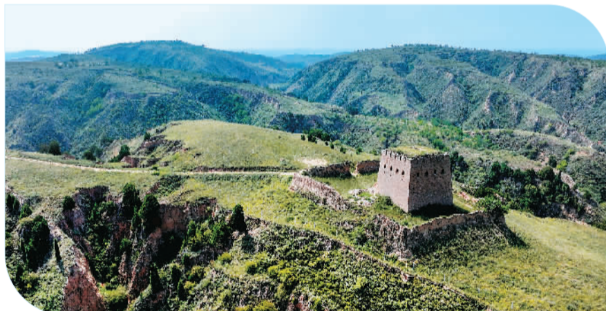
▶ 神木市“十三五”期间重点实施新一轮退耕还林京津风沙源治理、“两山”森林公园建设、交通骨干道路绿化等项目,全力推进沿黄生态保护廊道和沿长城生态绿色长廊建设。图为神木市店塔镇水头沟明长城烽火台遗址。