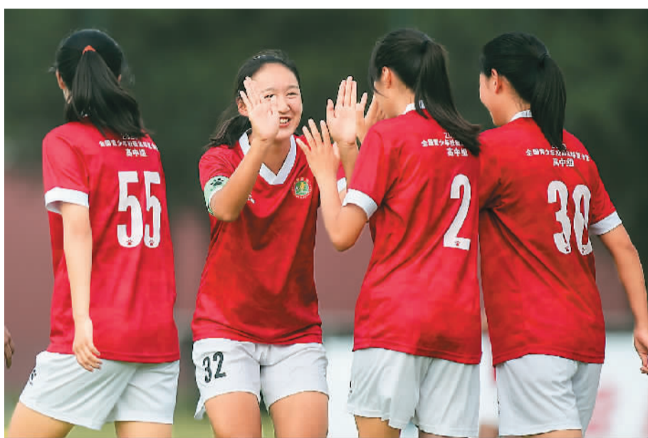
2020年全国青少年校园足球夏令营竞赛女子高中组比赛现场。

“这一全国性青少年足球竞赛平台之于学校体育改革、体教融合和中国足球改革都具有重要意义。”王登峰认为，中国