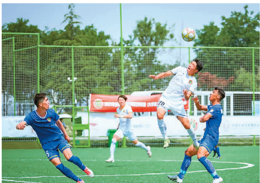
2021年全国青少年校园足球联赛（大学组）比赛现场。

青少年足球联赛打破了参赛壁垒和身份界限，可以为青少年足球运动员提供更多的比赛场次和实战锻炼机会，为中国足球遴选精英足球后备人才。