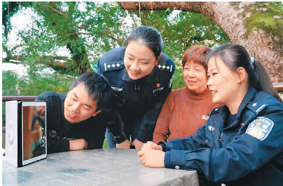
青田民警日前上门通过视频为一位意大利华侨办理国内子女户籍手续。

最近,在西班牙马德里,侨胞们感受到来自“天府之国”四川的温暖。不久前,“天府云医·海外惠侨远程医疗站”马德里站启动仪式在线上举行。“天府云医”由四川侨务部门联合相关单位、海外侨团建立,采取“互联网+医疗服务”模式,让广大侨胞足不出户即可享受到国内中医专家的专业诊疗,为侨胞防疫提供了有力支持。