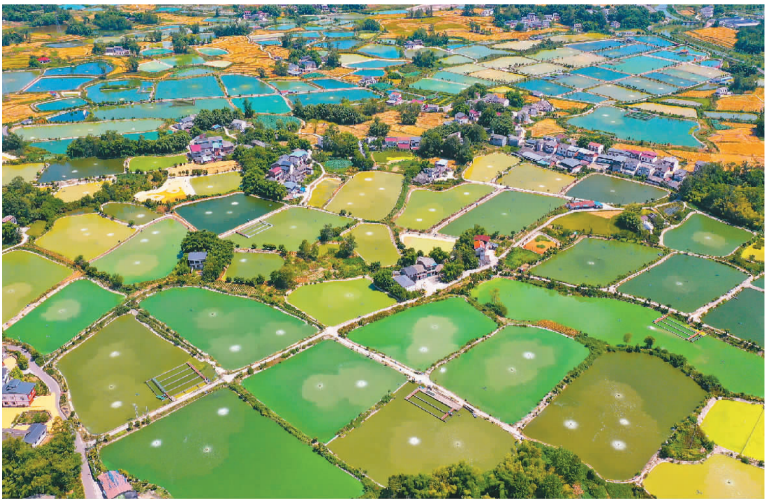
8月9日, 重庆市梁平区礼让镇川西村, 成片的鱼塘与村落、田园纵横交错, 诗画般的田园美景宛若“江南水乡”。