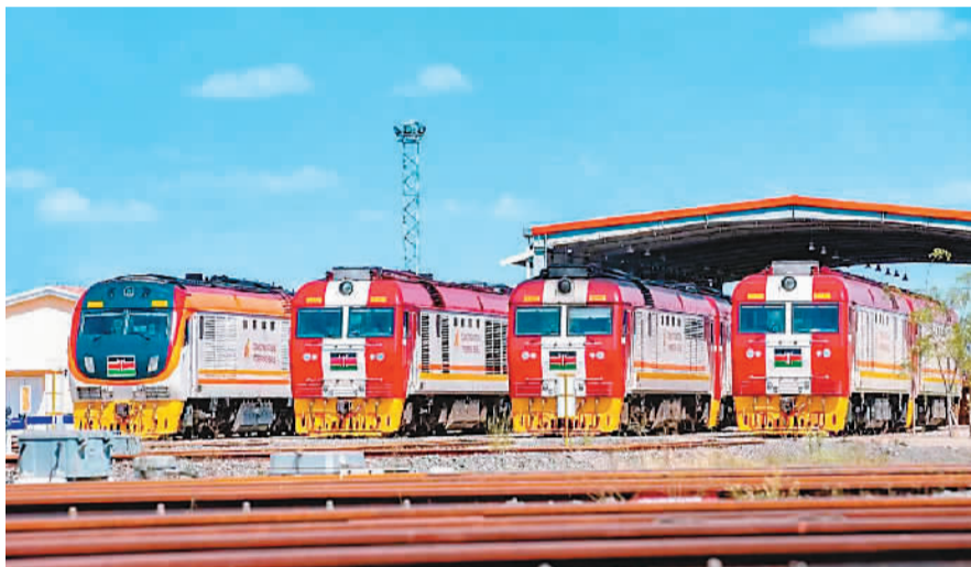
蒙内铁路上的机车。

肯尼亚人创造就业、希望、机遇和繁荣。”2017年5月31日蒙内铁路正式通车当天，肯尼亚总统肯雅塔的话如今已成现实。5年来，蒙内铁路不仅改善了肯尼亚人民的生活，推动了肯尼亚经济社会发展，实现了中国铁路技术转移，也改变了整个东非的交通乃至商业版图。列车呼啸，笛声长鸣，讲述着一个有关发展、合作和友谊的动人故事。