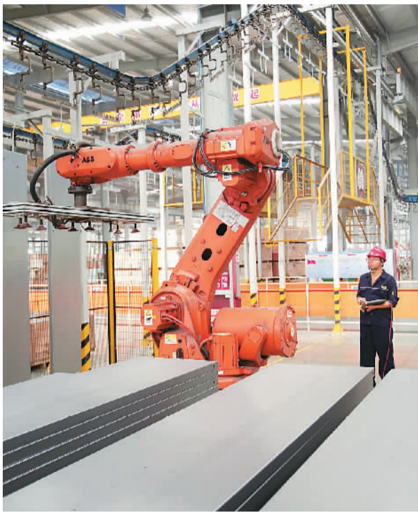
浙江省湖州市南浔区练市镇恒达富士电梯有限公司内,工人在生产发往海外的电梯。