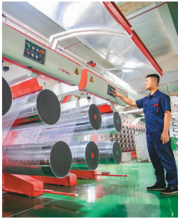
江西省九江市湖口县新动能产业园内的敏正塑业有限公司内,工人正在赶制出口订单。

本报北京8月5日电 (记者邱海峰) 国家外汇管理局5日公布的国际收支平衡表初步数据显示,2022年上半年我国国际收支保持基本平衡。其中,经常账户顺差1691亿美元,与同期国内生产总值(GDP)之比为1.9%,继续处于合理均衡区间;来华直接投资净流入1496亿美元。