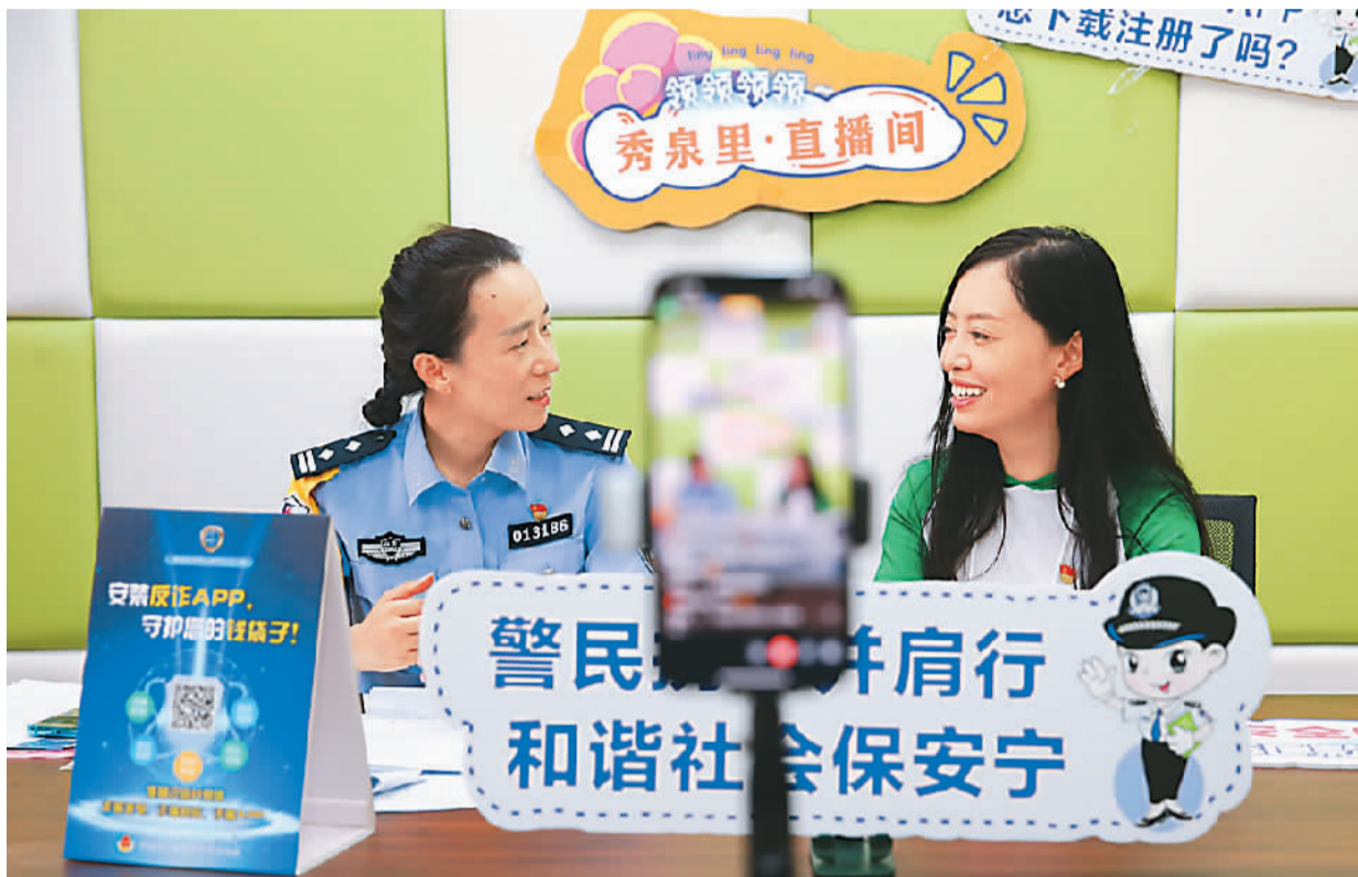
山东省济南市公安局市中区分局刑警大队反诈一中队与十六里河派出所民警来到秀泉社区直播间,在社区书记配合下开展“线上”反诈宣传。

司法部普法与依法治理局副局长杨金宇介绍,全国普法办建立智慧普法平台,整合6000多家新媒体,组成全国普法新媒体矩阵,每天推送信息数万条,这些内容受到网友的喜爱与点赞。近两年,司法部、全国普法办在全国持续开展“疫情防控、法治同行”专项行动,编