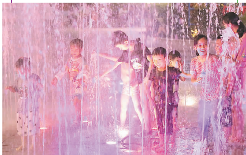
下图：7月26日，孩子们在广西壮族自治区南宁市航洋国际城前广场戏水纳凉。