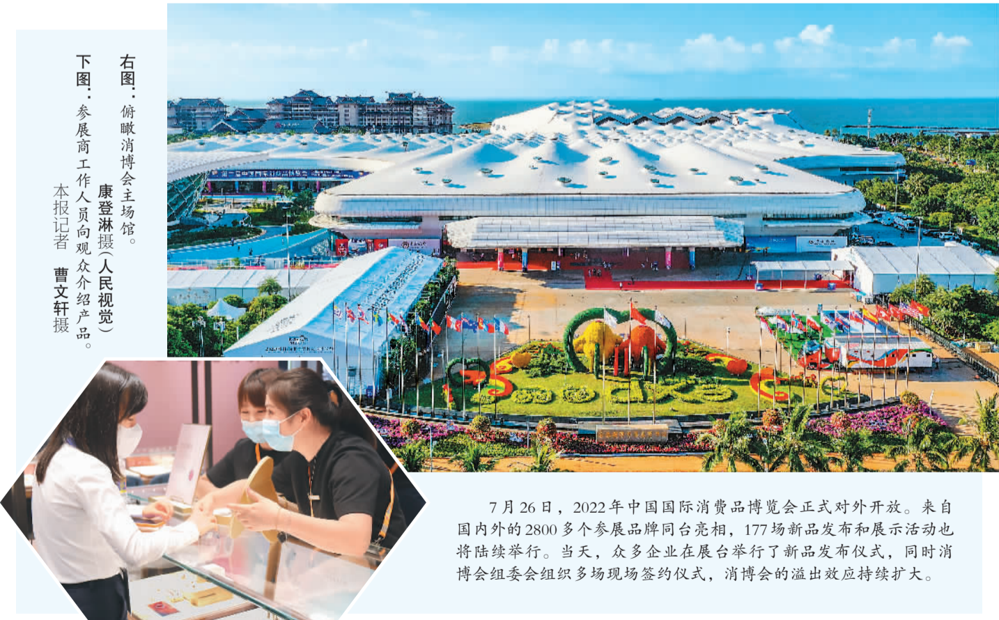
右图:俯瞰消博会主场馆。 下图:参展商工作人员向观众介绍产品。

与此同时,制造业生产模式发生了深刻变革,重点工业企业关键工序数控化率、数字化研发设计工具普及率2021年分别达到55.3%和74.7%,较2012年分别提高30.7和25.9个百分点。下一步,工信部将统筹好短期稳增长和中长期提质增效升级,加快新旧动能接续转换,推动制造业高质量发展。