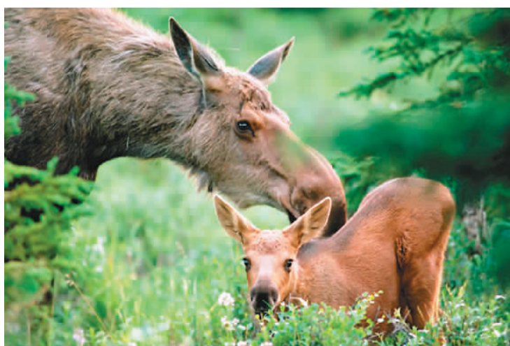
上图：2022年新增的蒙古库苏古尔湖生物圈保护区。 左图：2022年新增的哈萨克斯坦布拜拜生物圈保护区。