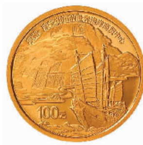
8克圆形精制金质纪念币背面图案