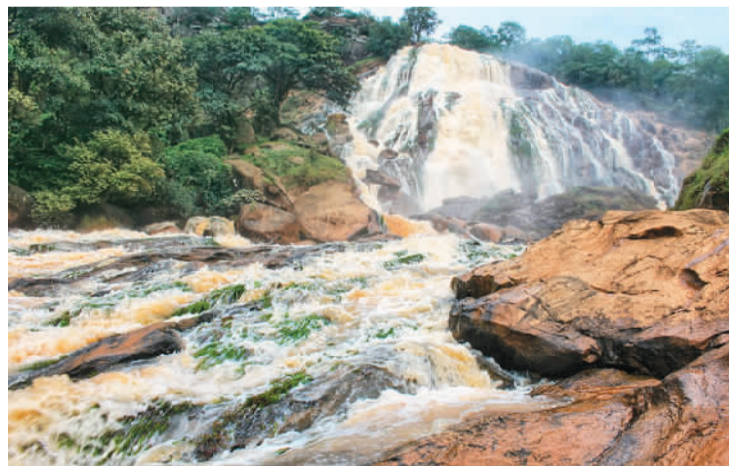
上图：2022年新增的喀麦隆顿巴雷生物圈保护区。

生物圈保护区获得认定后，依旧由所在国管辖。在世界生物圈保护区网络内，各保护区之间可以在国内、区域内、世界范围内分享各自的经验和理念。