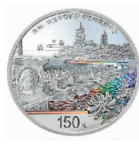
500克圆形精制银质纪念币背面图案

为庆祝福建泉州申遗成功一周年，中国人民银行定于2022年7月25日发行世界遗产（泉州：宋元中国的世界海洋商贸中心）金银纪念币一套。该套金银纪念币共4枚，其中金质纪念币2枚，银质纪念币2枚，均为中华人民共和国法定货币。