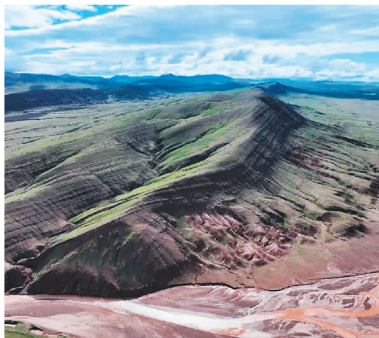
红色地层南北出露宽度超过160公里，东西延伸长度近600公里。红色地层出露面积之大在国内罕见。这片“红山脉”系唐古拉山的砖红色、紫红色岩石遭受风化、剥蚀后，被河流搬运到可可西里盆地内沉积下来，后期又受到地质构造运动改造后露出地面，形成了如今地貌。（新华社发）