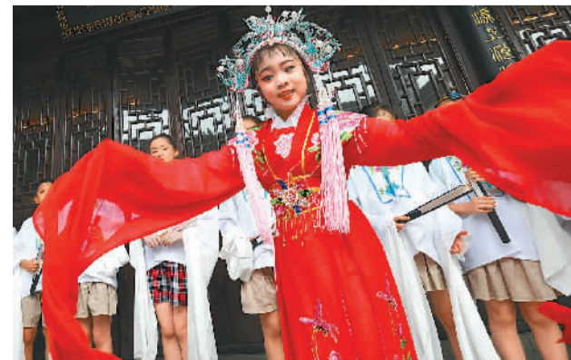
7月16日，浙江省湖州市德清县组织开展“学戏曲，传国粹”暑期春泥计划公益课堂活动，学生们在老师的指导下学习戏曲表演，感受中国传统艺术的魅力，丰富假期生活。图为孩子们在练习戏曲表演基本功。