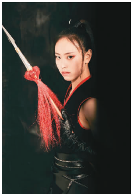
凌云与某游戏合作，演示峨眉枪法招式。

2014年，敦煌莫高窟数字展示中心建成。莫高窟数字展示中心将数字化资料制作成影片，循环播放介绍敦煌莫高窟历史文化背景的主题电影《千年莫高》和展示精美石窟艺术的球幕电影