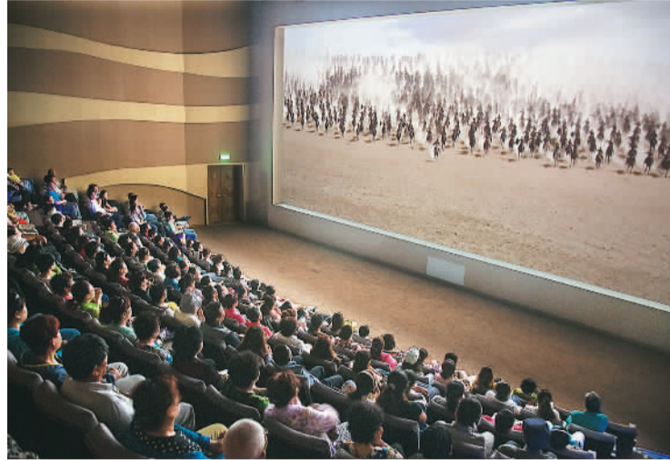
▲敦煌莫高窟官方虚拟形象“伽瑶”。 ▲游客在莫高窟数字展示中心观看主题电影《千年莫高》。