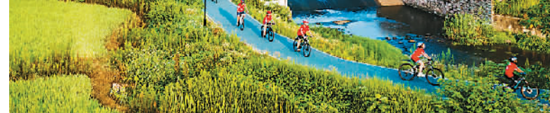
7月19日,安徽省芜湖市繁昌慢谷旅游度假区,孩子们在城溪河畔的骑行步道上骑行晨练,乐享“双减”政策落地后的首个暑假生活。

据介绍,中国残疾人事业新闻宣传促进会和北京快手科技有限公司启动公益合作,双方将在公益助残短视频推广、公益助残项目运营、残障人士书画展、公益拍卖等方面展开合作,加大对残疾人事业的宣传。