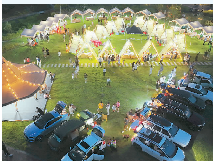
▲入夏以来,浙江省湖州市德清县各乡村推出野外露营、夜间游乐、非遗市集等活动,集聚人气,激活乡村文旅消费新动力。图为村民和游客在该县莫干山镇高峰村逛夜市。