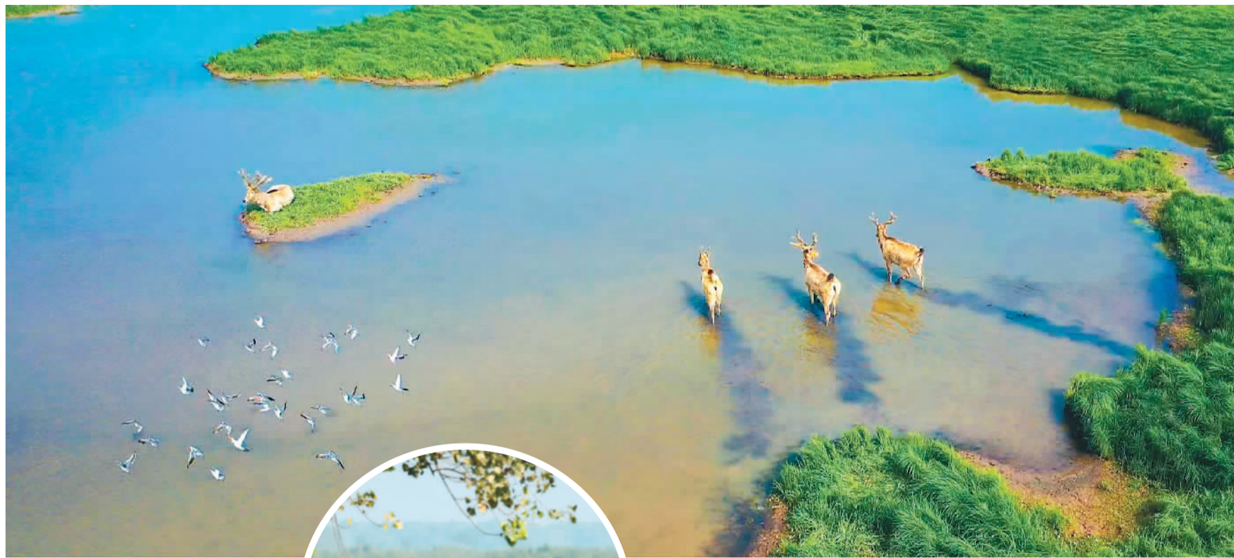
洞庭湖湖中的麋鹿。

古塔悠悠，见证人事代谢，俯瞰往来古今。汉溪奔流，涌涌百里新安，心向浩瀚东海。在新时代光辉的映照下，古塔又一次写下瑰丽诗篇，与汉溪共生共长，随一江碧水东流去。