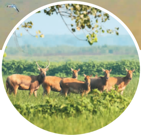
洞庭湖岸上的麋鹿。

也许是神兽命不该绝，当时英国有个特别喜欢鹿科动物的人士十一世贝福特公爵。他花重金将分散饲养在巴黎、柏林、科林、安特卫普等动物园的麋鹿共18头全部买下，放养在伦敦以北一