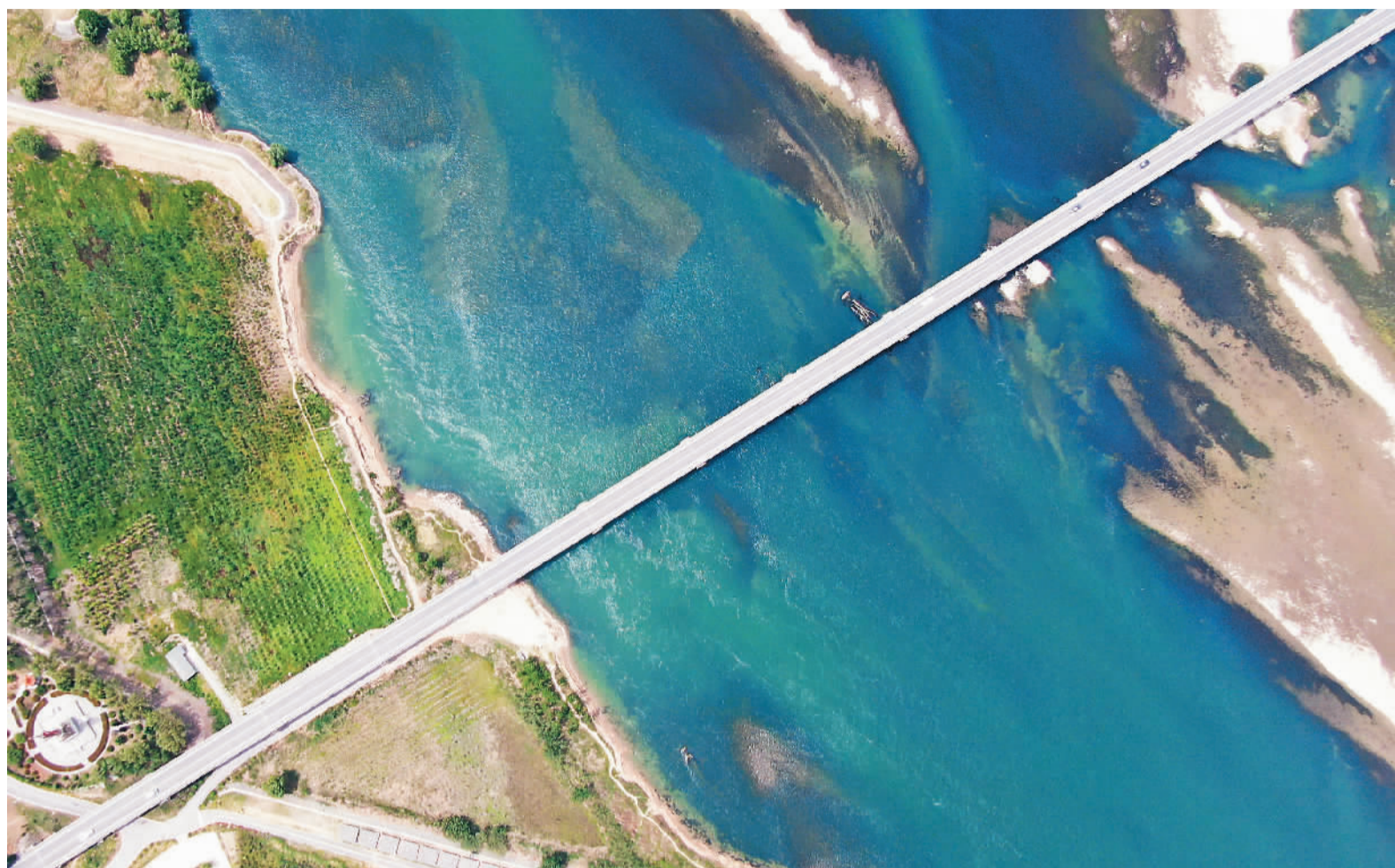
4月26日拍摄的河南黄河湿地国家级自然保护区孟津段（无人机照片）。