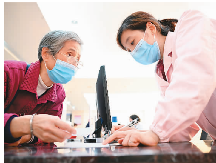
福建省三明市第一医院医保办工作人员（右）向前来咨询药品报销问题的居民讲解相关政策（2020年11月18日摄）。