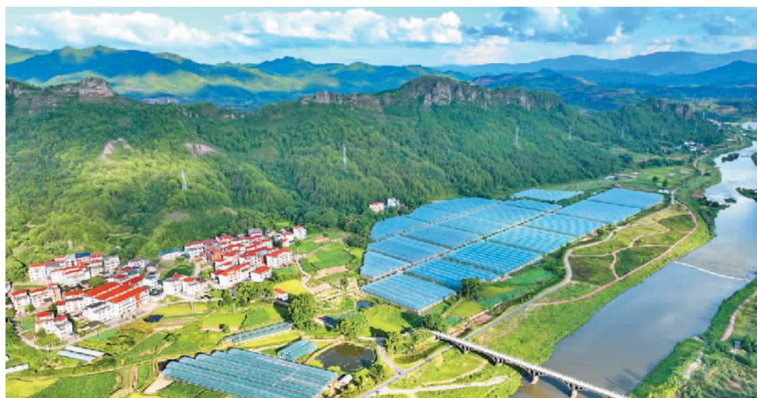
江西省赣州市石城县通过引进种植大户、企业发展设施农业，建设蔬菜大棚种植基地1万余亩，确保乡村振兴有产业支撑、农户可持续增收。图为石城县琴江镇江背村的蔬菜种植大棚。

RCEP生效实施半年以来，北部湾港集团抢抓机遇，探索外贸特色增量货源，西部陆海新通道班列频频“首发”，不断增加线路，扩大动能，截至6月30日，新增“太阳村—北部湾港”“崇左—北部湾港”“百色—北部湾港”“印度—钦州—都拉营”等8条一口价线路，西部陆海新通道服务范围拓展至14省份54市105站点。