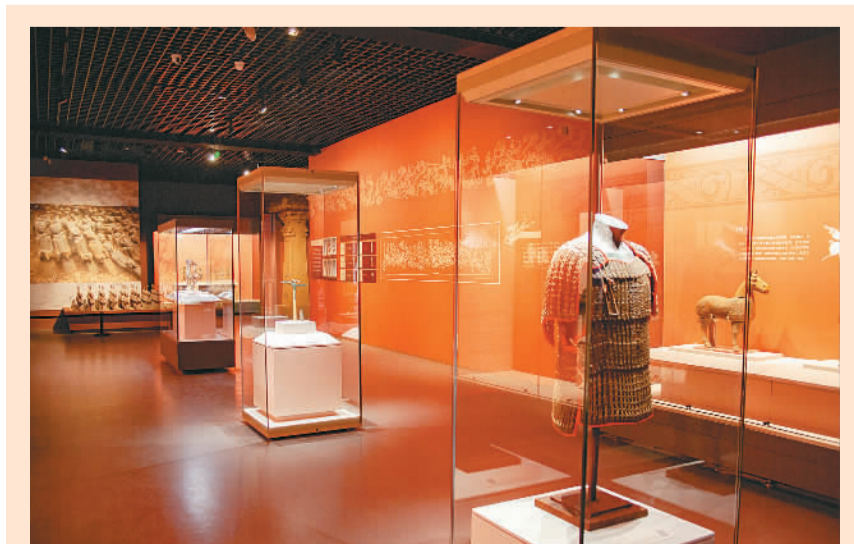
“大汉楚王——徐州汉代楚国文物精品展”展厅。

据悉，此次展览展期至10月10日。围绕展览，山西博物院还推出网上展厅、直播、专家讲座及研学教育等系列配套活动。