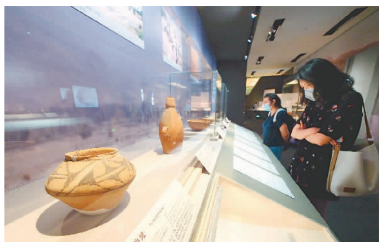
观众参观“积厚流广——国家博物馆考古成果展”。