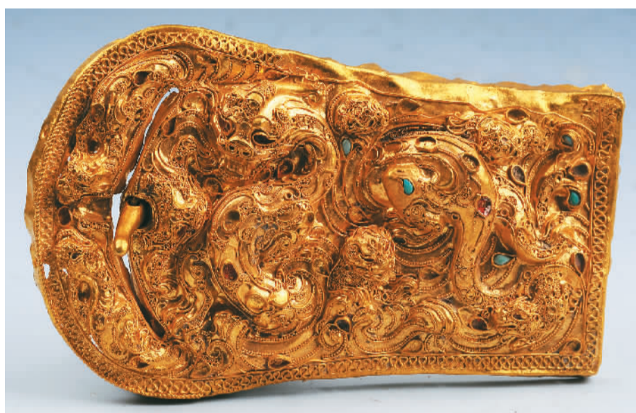
▲唐开元二十一年唐益谦、薛光泚、康大之请过所案卷。 ▲汉代八龙纹金带扣。

实物。文书记录内容丰富，涉及军事、政治、经济、文化、法律、交通、社会生活、宗教信仰等方面，诸多内容均为首次发现，具有极高的史料价值。展厅设专区陈列克亚克库都克烽燧遗址出土的部分纸质文书和木牍，旁边还展示了烽燧的立面复原模型，让观众感受新疆最新的重大考古发现成果。