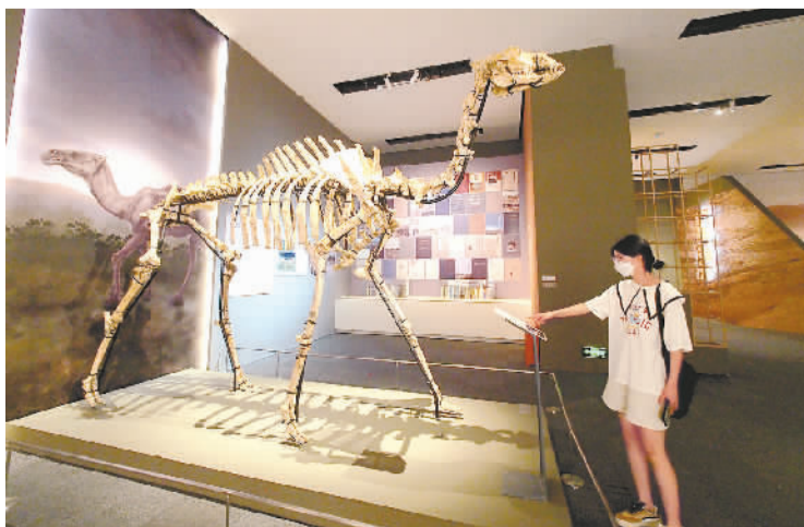
金远洞巨副驼骨架。

本次展览还引入科技元素，增强互动体验。“中条山金”展柜将实物展示与电子触屏结合，多角度呈现了晋南中条山地区闻喜千斤耙遗址、绛县西吴壁遗址的考古成果。展柜里陈列着遗址中出土的石锤、矿渣、范芯等，展柜玻璃则被设计成一块电子触摸屏，展示了考古现场图片、木炭窑模型以及从冶铜到铸造青铜器的工序等。点击屏幕上的模块，就能看到更为详细的解读。这两处遗址是考古工作者首次在中原地区发掘的采矿、冶铜遗址，极大地填补了冶金考古领域的空白，为认识夏商王朝控制、开发、利用中条山铜矿资源提供了珍贵的实物资料，其中绛县西吴壁遗址入选了“2019年度全国十大考古新发现”。