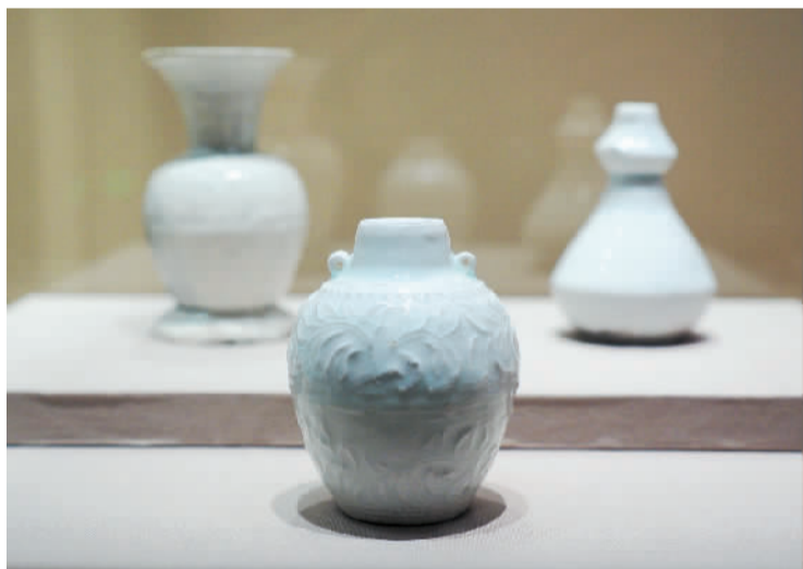
“南海一号”沉船出水的南宋青白釉双系小罐。

“南海一号”沉船出水的南宋青白釉印花瓷器、龙泉窑青瓷，“碗礁一号”沉船出水的清代青花盖罐、五彩瓷器……这些精美的外销瓷器见证了中国古代海上丝绸之路的繁荣，对研究中国航海史、海外交通史具有重要价值。展厅里还陈列着两套水下考古所用的蛙人潜水服，配合投影在地面上的水波光效，令观众感觉仿佛亲临海底沉船发掘现场。