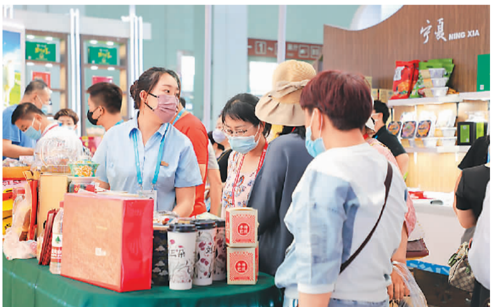
第二十八届中国兰州投资贸易洽谈会近日在甘肃省兰州市开幕。图为宁夏展商在兰洽会上向参会者推介商品。

第28届中国兰州投资贸易洽谈会近日在甘肃省兰州市拉开帷幕。作为西部地区主题鲜明、特色突出的重要贸易投资促进平台，本届兰洽会以新通道、新材料、新能源为代表的绿色产业频频“亮相”，截至目前签约项目金额达4300亿元，比上届增长10%，合作交流成果丰硕。