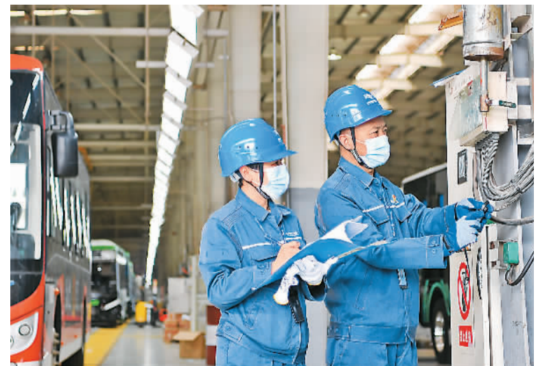
为保障企业复产稳产，贵州贵阳电力部门日前组织园区服务队前往贵阳多个工业园区开展用电检查，及时解决企业用电需求和用电安全问题。图为南方电网贵阳供电局园区服务队工作人员在贵阳小孟工业园区的一家企业，对生产及检查设备进行安全用电“体检”。

据介绍，此次出台的方案中涵盖了22条政策措施，从鼓励科技成果就地转化、加大“高精尖缺”人才补贴力度、创新投融资模式等方面给予政策保障。力争到2025年，“科大硅谷”将汇聚各类优秀人才超10万名，基本规模超2000亿元，集聚各类科技型企业、新型研发机构、科创服务机构等超1万家及培育高新技术企业1000家等。