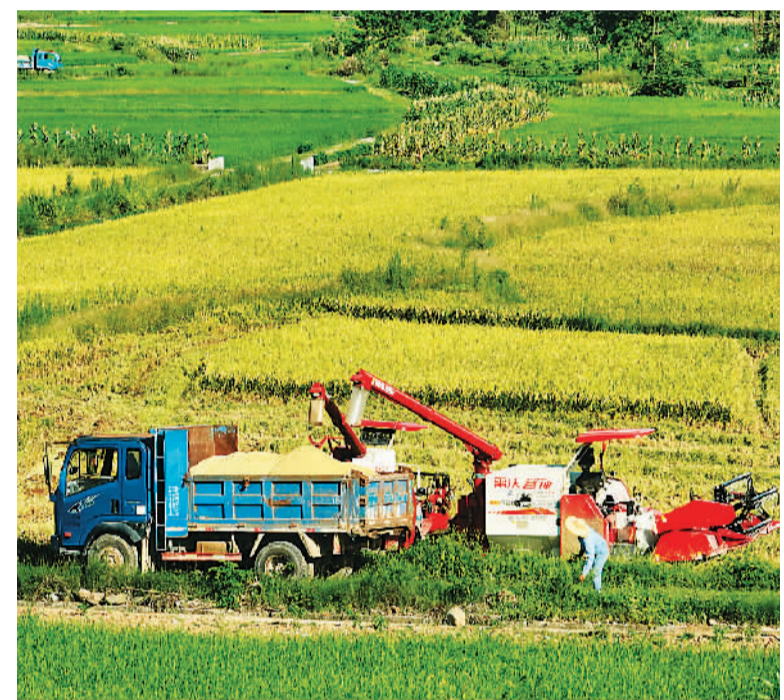
眼下正值早稻收割时期，湖南省永州市道县采取机收主导、人工结合方式，抢收早稻。图为7月11日，在永州市道县四马桥镇金狮头村，农民驾驶大型机械收割早稻。

求，持续推出专场招聘。截至7月3日，线上举办招聘会10662场次，共计55万家用人单位发布岗位需求1448万人次，上线求职的劳动者1336万人次。线下举办招聘会4268场次，共计9万家用人单位提供岗位需求241万人次。