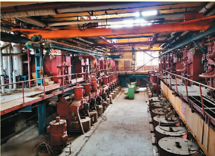
上图为1964年江門甘蔗化工厂编制的化驗操作規程，涉及对甘蔗制糖原材料和半成品的分析实验，成为业内参考资料。下图为江門甘蔗化工厂（制糖分厂）保存现状。