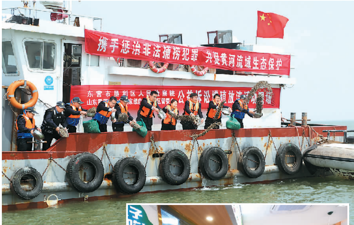
▲山东省东营市近日在黄河三角洲国家级自然保护区外围毗邻海域开展涉环境公益诉讼增殖放流活动，2300万余粒贝类幼苗被放入渤海。

面对提问，最高检党组书记、检察长张军回答：“公益诉讼检察工作就是以诉的形式履行法律监督的本职。”半年后，2020年全国两会期间，张军向大会报告最高人民检察院工作时，提出“坚持把诉前实现维护公益目的作为最佳司法状态”。由此可见，维护公共利益，不一定靠“诉”解决。