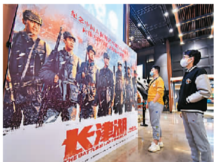
年轻人人在北京一家影院观看电影《长津湖》的海报。

今年5月，海南省三亚市城郊人民法院对被告人罗某某侵害英雄烈士名誉、荣誉罪刑事附带民事公益诉讼一案依法公开宣判。法院经审理查明：2021年10月，被告人罗某某为博取关注，使用微博发布帖文，侮辱在抗美援朝长津湖战役中牺牲的中国人民志愿军英烈。法院认为，被告人罗某某在互联网上侮辱英烈，其行为已构成侵害英雄烈士名誉、荣誉罪。罗某某具有自首情节，自愿认罪认罚，愿意赔偿公益损害赔偿金8万元，法院予以认可。公诉机关提请对罗某某判处有期徒刑7个月的量刑建议适当，法院予以采纳。