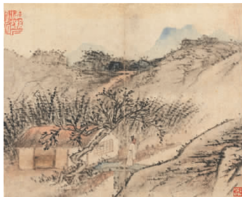
山水册页 (清) 石涛