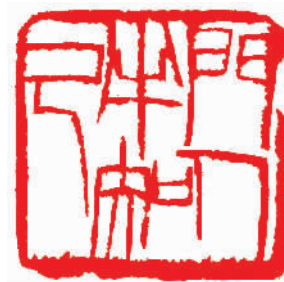
门人半知己(印文) 齐白石

齐白石、于非闇、王雪涛是享誉20世纪中国画坛的花鸟画大师。三人有师徒之缘,又同为北京画院画家,但在艺术面貌上却各开新境:齐白石以“红花墨叶”的大写意成一代宗师;于非闇以同宋人比肩的工笔画再开新境;王雪涛以灵动逼真的小写意鹤立艺苑。