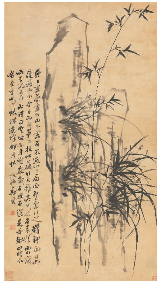
兰竹图 (清) 郑燮