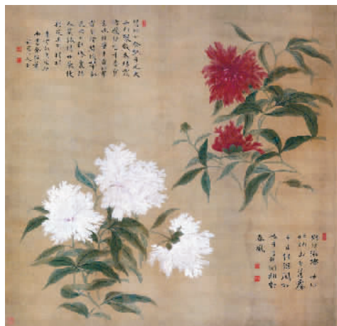
红白芍药图 (清) 华品

于非闇、王雪涛不仅是齐白石艺术上的知己,更继承了他艺术革新的理念。师徒三人分别选择大写意、工笔、小写意三种不同的艺术表现手法,在各自的时代开拓出花鸟画新境,也使得20世纪花鸟画呈现出百花齐放的勃勃生机。