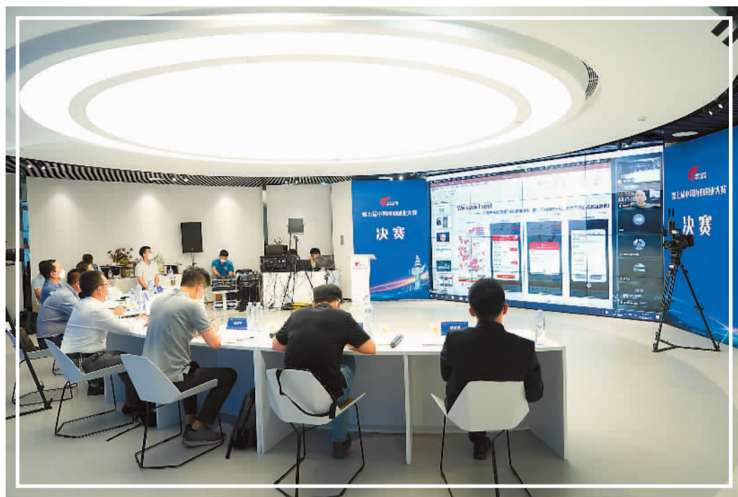
第七届中国海归创业大赛决赛现场,参赛团队在线上展开角逐。

自2015年首次举办以来,中国海归创业大赛已累计吸引3499个海归项目团队参赛,成为一个激发海归创业活力、鼓励支持海外留学人员回国发展的重要平台。