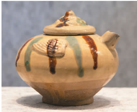
秦淮河西水关出土的唐代长沙窑青釉褐绿彩瓷壶。

南京，伴随着中华文明的历史进程，从秦淮河源头的江南聚落发展为中国统一王朝的首都，并沿着长江走向海洋，汇入滚滚浪潮中。