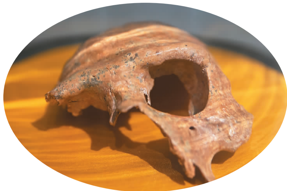
左图：南京直立人1号头骨化石。右图：明代沐启元墓出土的嵌宝石金盒。