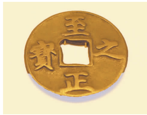
元顺帝至正年间“至正之宝”。